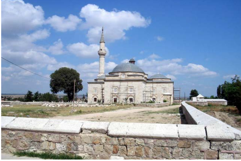
No: 5. Muradiye Camii / Güney Cephesi