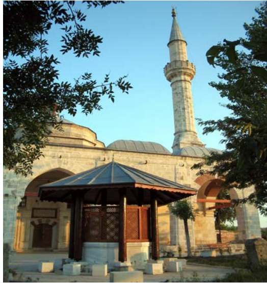
No: 8. Muradiye Camii ve Şadırvanı / Kuzey Cephesi