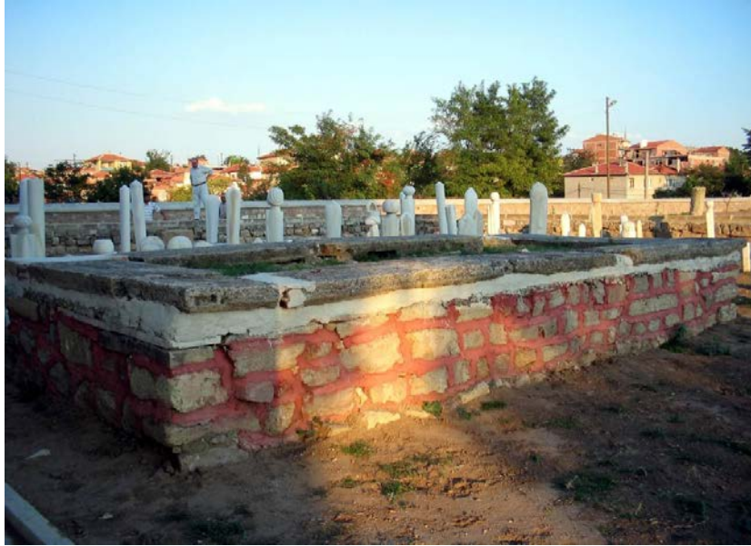
No: 2. Çelebi Celaleddin ve Cemaleddin Efendilerin Kabirleri Edirne Muradiye Hâmûşânı.