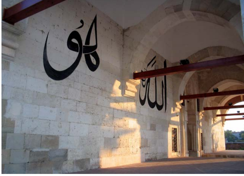
No: 7. Muradiye Mevlevîhanesi Kuzey Cephesi