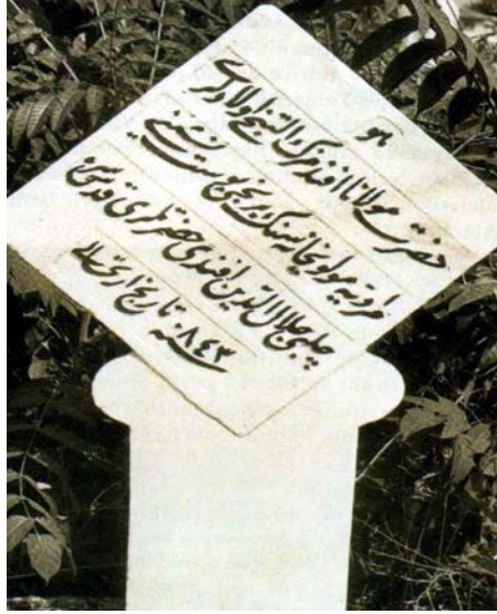
No: 3. Muradiye Mevlevîhanesi'nin İlk Postnişini Çelebi Celaleddin Efendi'nin Mezar Taşı