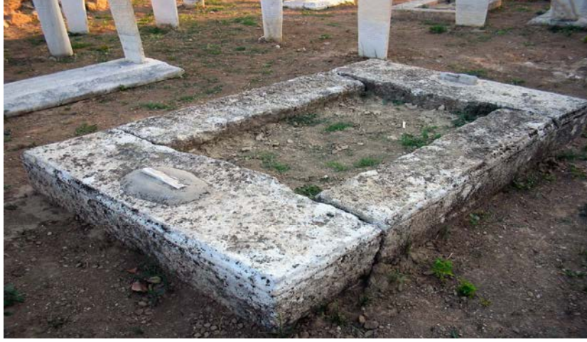
No: 1. Şeyh Neşâtî Ahmed Dede'nin Kabrinin Son Durumu (2006)