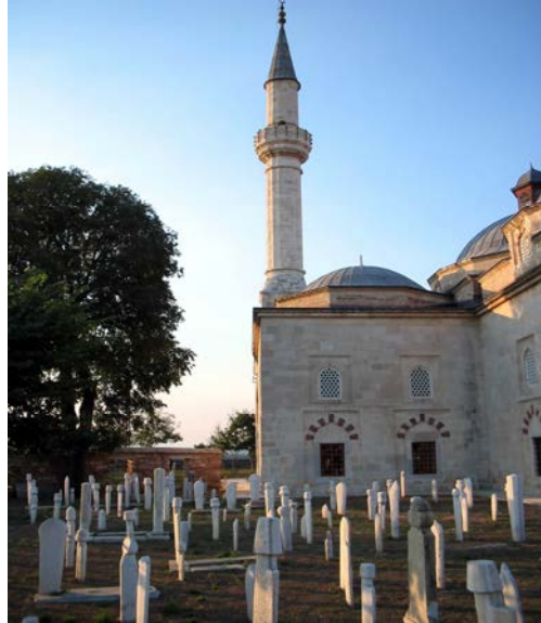
No: 6. Edirne Muradiye Camii (Mevlevihanesi)