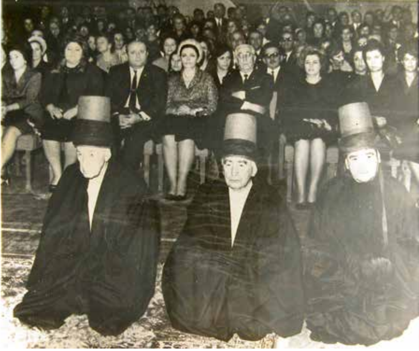
Süleyman Demirel'in katıldığı Şeb-i Arus.