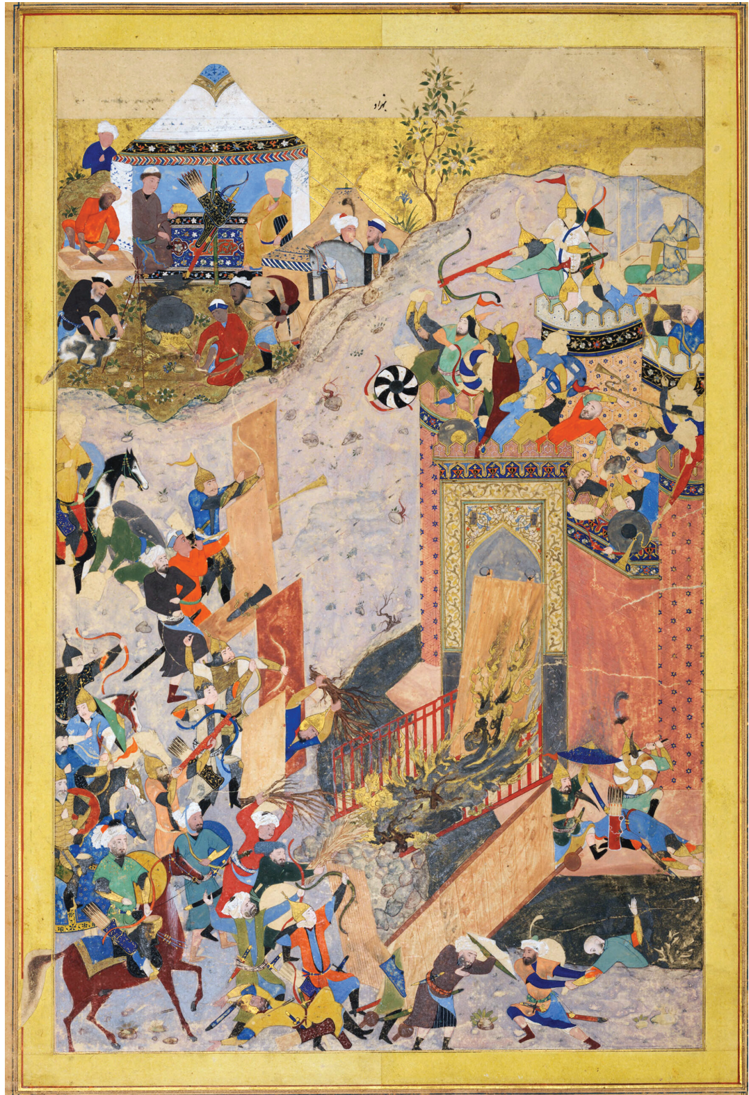
Moğol İstilası, Harvard Sanat Müzesi