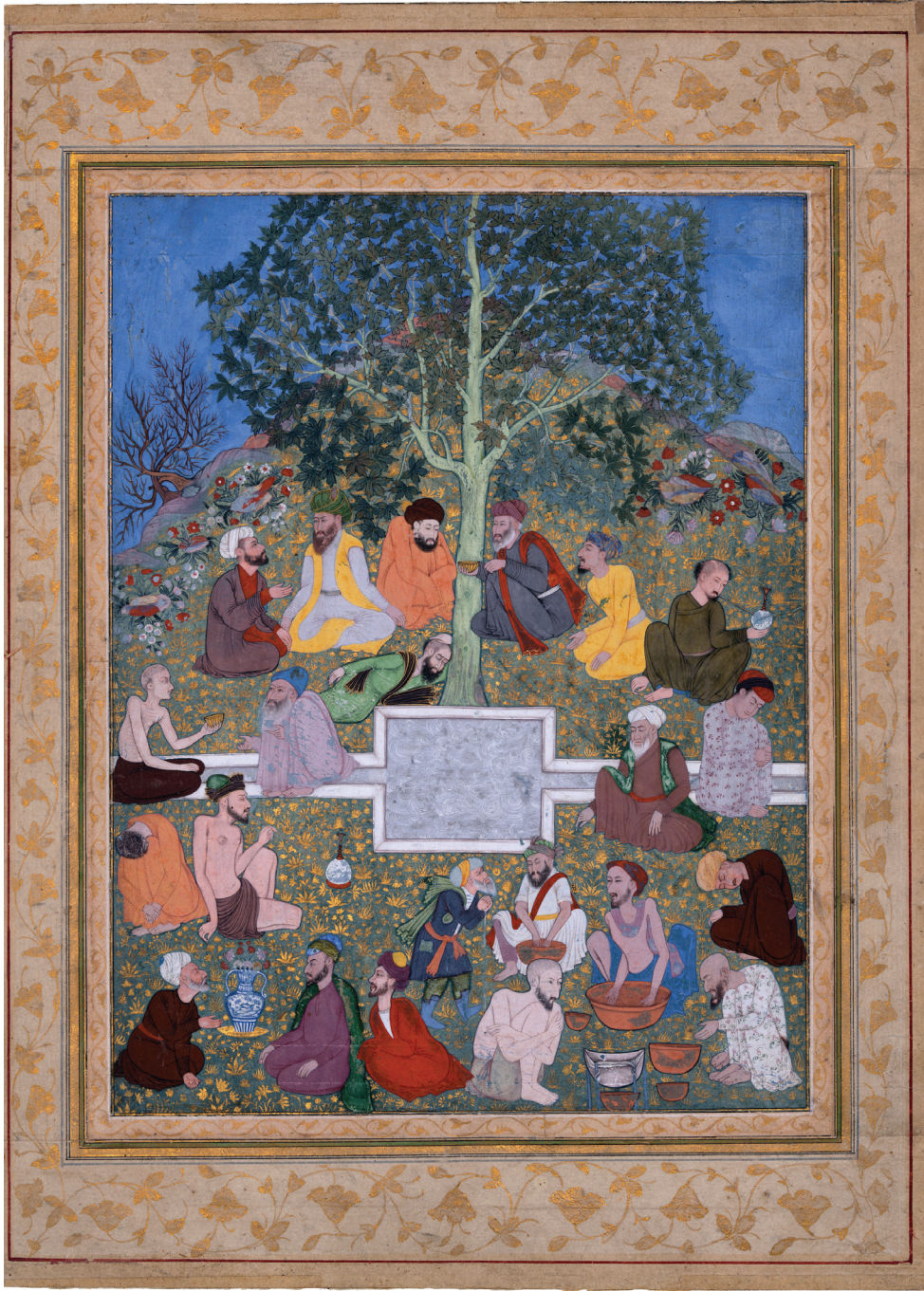
Dervişlerin toplantısı. Metropolitan Müzesi

daima himaye etmiş hatta onlara intisap etmiştir. Özellikle Muhyiddin İbnü'l Arabî'yi Konya'ya ve sarayına davet etmiştir. Selçuklu