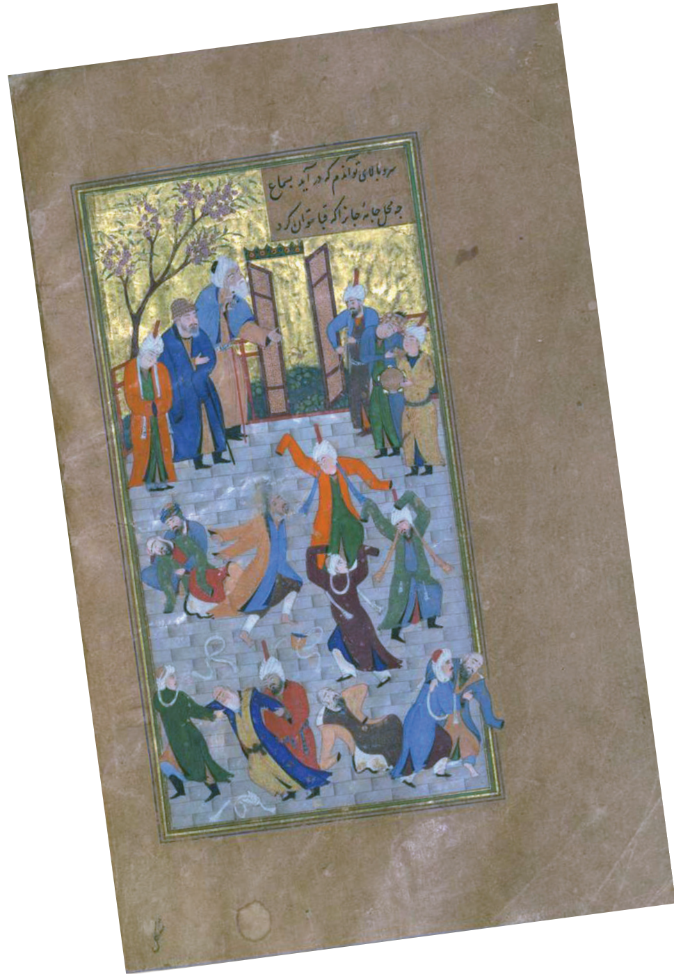
Semâ eden dervişler. Hâfız Divânı, Walters Sanat Müzesi