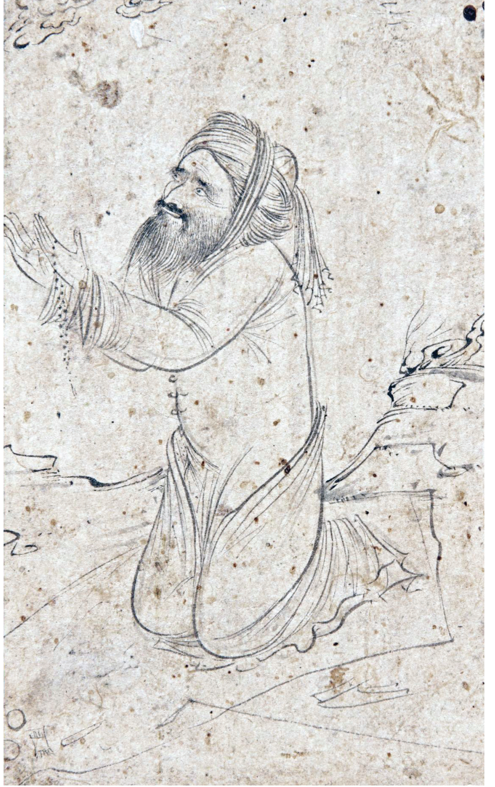
Duâ eden bir derviş. Albüm, Harvard Sanat Müzesi

II. Kılıç Arslan'ın hükümdarlık yaptığı dönemde (1156-1192), iç huzurun sağlanması ve kazanılan istikrar sonucunda ortaya çıkan güven ortamı diğer memleketlerden çok