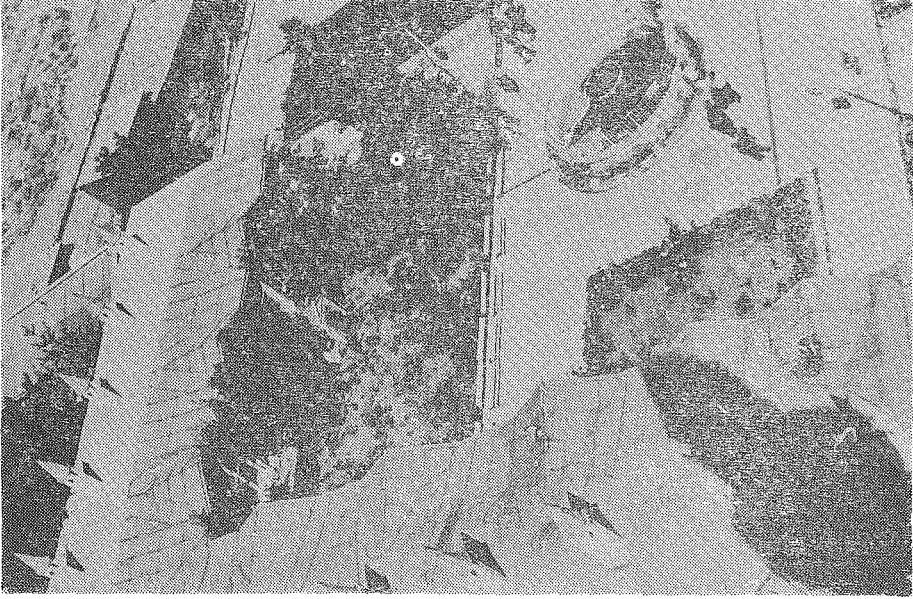
RESİM 1: Batı taraftaki avlu, şadırvan, selsebil ve derviş hücreleri

Bu gün batı tarafta görülen hücrelerin, Sultan III. Murat zamanında inşa ettirildiğine dair, üç satır halinde Türkçe talik kitabesi, avluda muhafaza edilmektedir. Bunlar, Mevlevilikte önemli rakam olan, 18 tane olup, önlerinde bir revak uzanmaktadır (Res. 1).