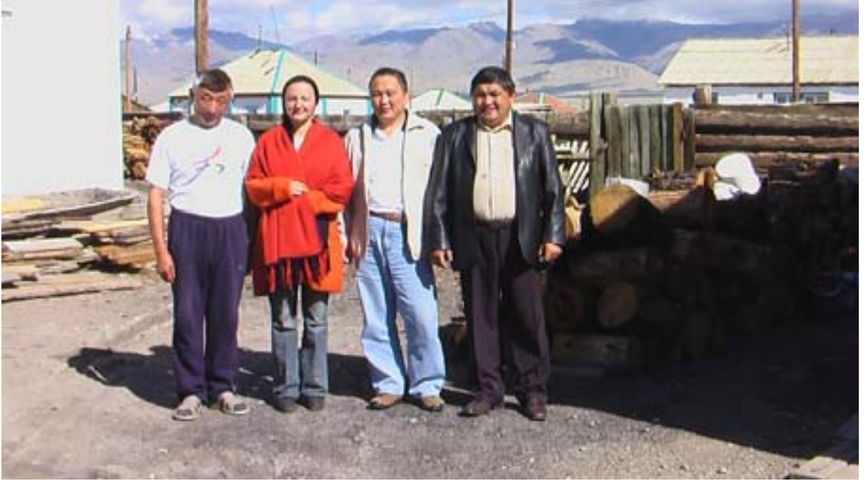
R.1 Moğolistan Sınıırında Bir Köy, Ağustos, 2006, Altay, G. Yücekal Ermetin