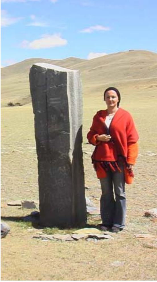
R.22 Moğol Sırında Bir Taş Yazıt , Ağustos, 2006, Altay,