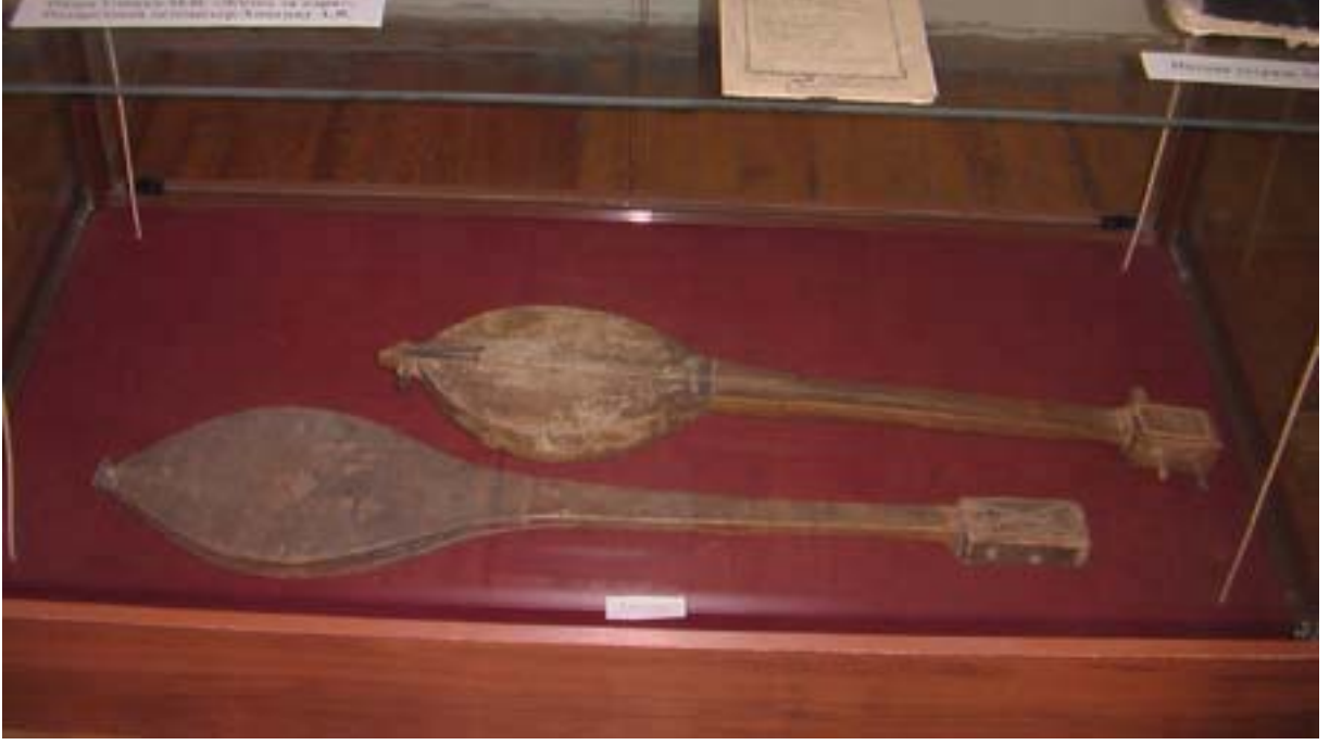
R.32 Altay Müzesinden Kam Kopuzu, Ağustos, 2006, Altay, G. Yücekal Ermetin