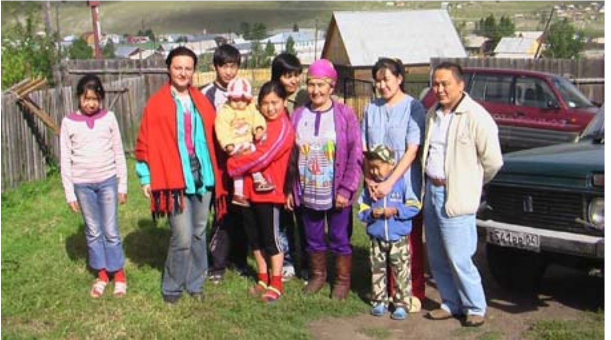
R.6 Bir Telengit Köyü, Ağustos, 2006, Altay, G. Yücekal Ermetin