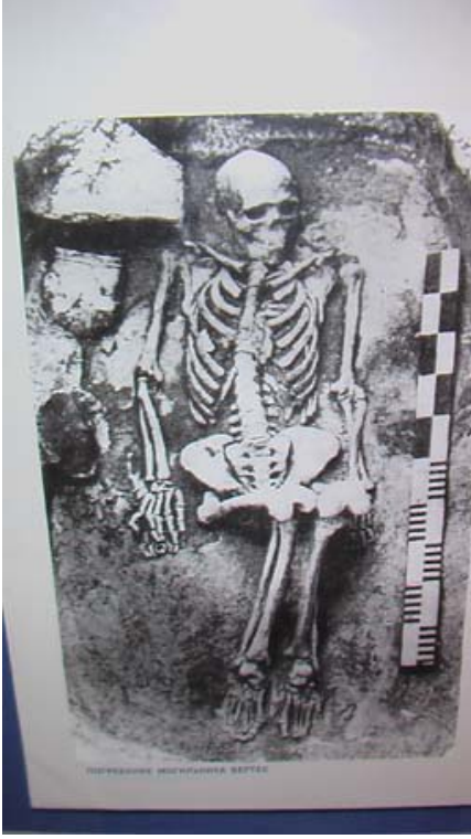
R.18 Altay Müzesinden Açılmış Bir Kurgan Resmi, Ağustos, 2006, Altay, G. Yücekal Ermetin