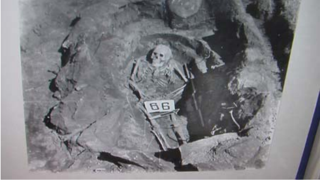
R.19 Altay Müzesinden Açılmış Bir Kurgan Resmi, Ağustos, 2006, Altay, G. Yücekal Ermetin