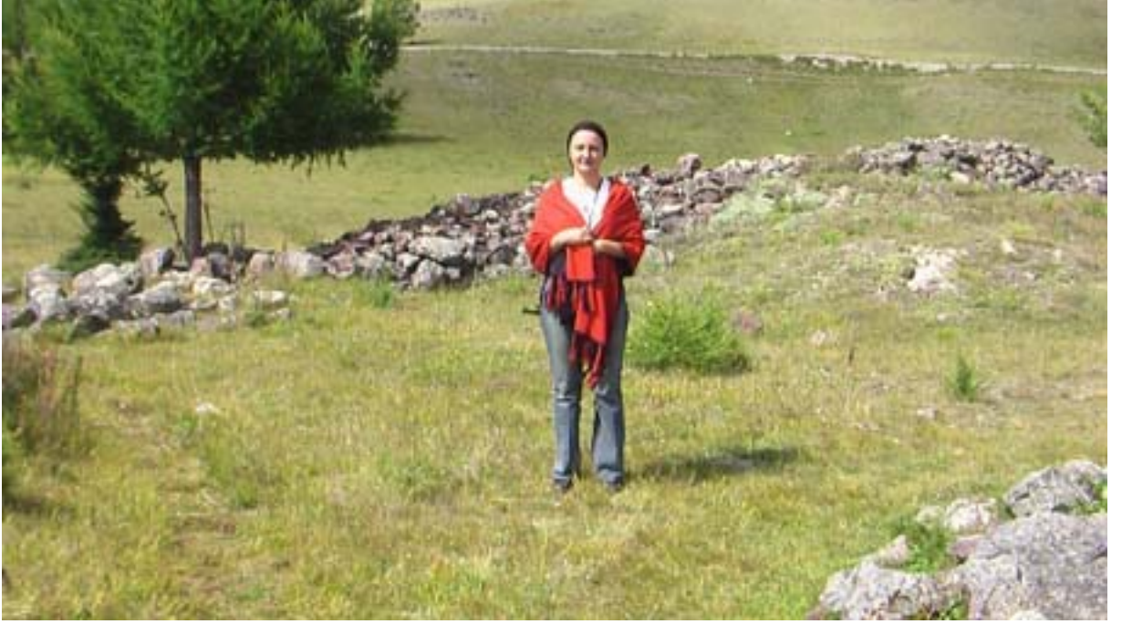
R.11 Pazırık Kurganları, Ağustos, 2006, Koşagaç, G. Yücekal Ermetin