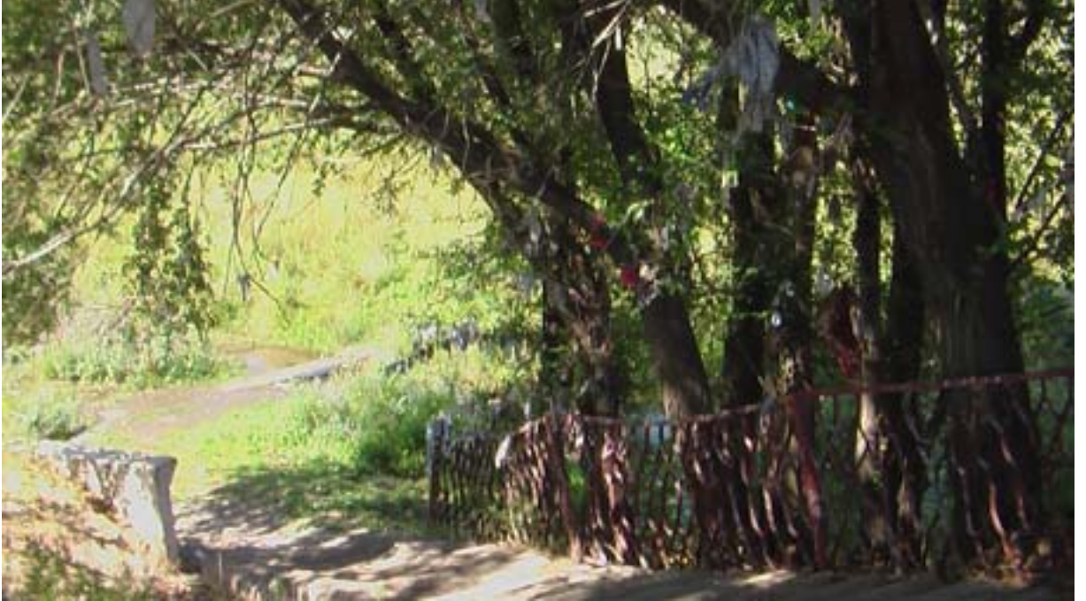
R.23 Su Kenarında Ağaçlara Bağlanan Bezler, Ağustos, 2006, Altay, G. Yücekal Ermetin