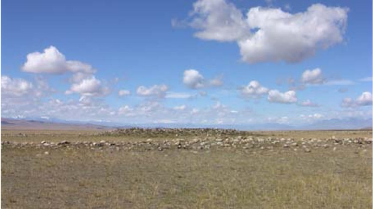
R.14 Sümer Dağlarının Eteklerinde Bir Kurgan, Ağustos, 2006, Altay, G. Yücekal Ermetin