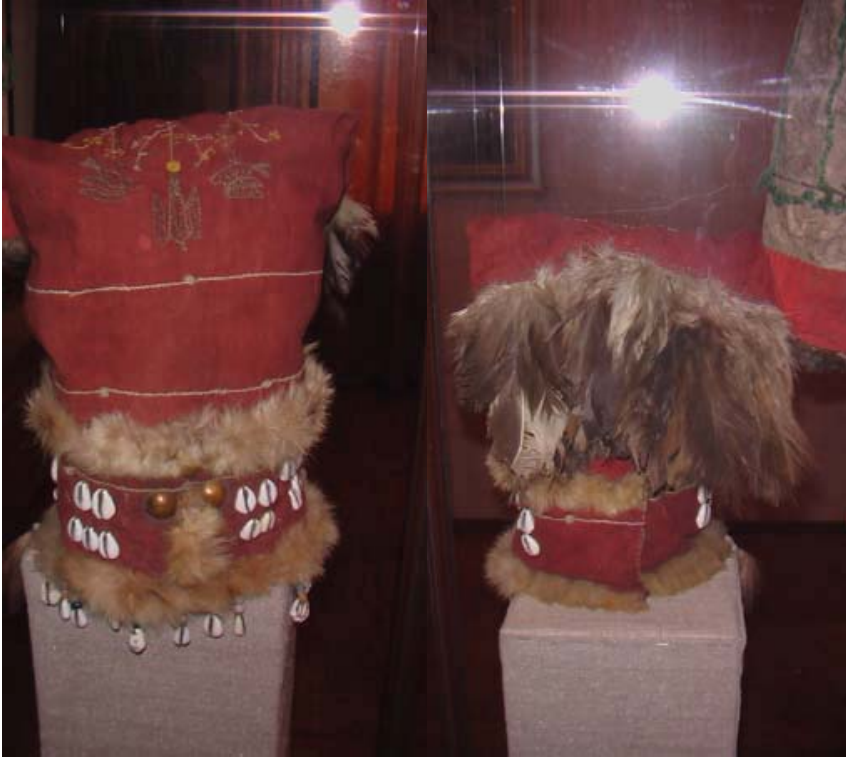
R.25 Altay Müzesinden Ön Cepheden Bir Kam Başlığı, Ağustos, 2006, Altay, G. Yücekal Ermetin