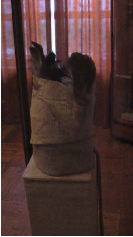
R.24 Altay Müzesinden Bir kam Başlığı, Ağustos, 2006, Altay, G.