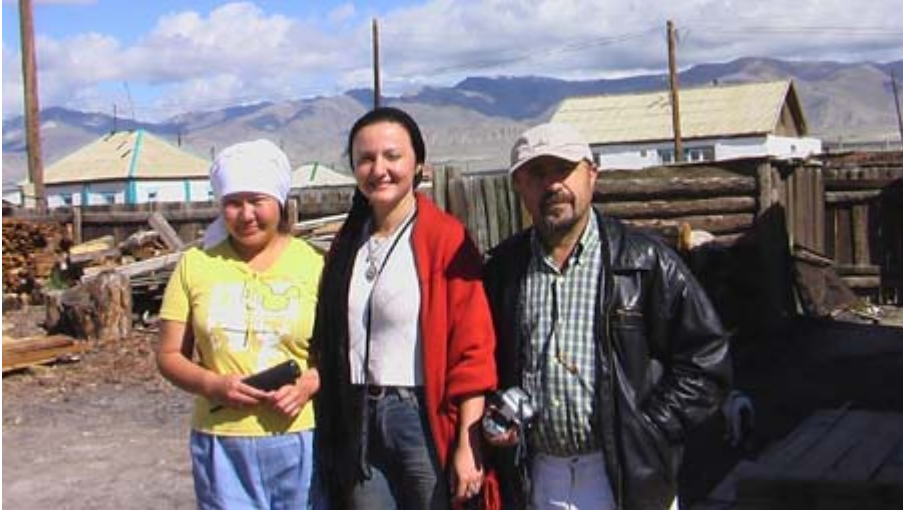
R.2 Moğolistan Sınıırında Bir Köy, Ağustos, 2006, Altay, G. Yücekal Ermetin