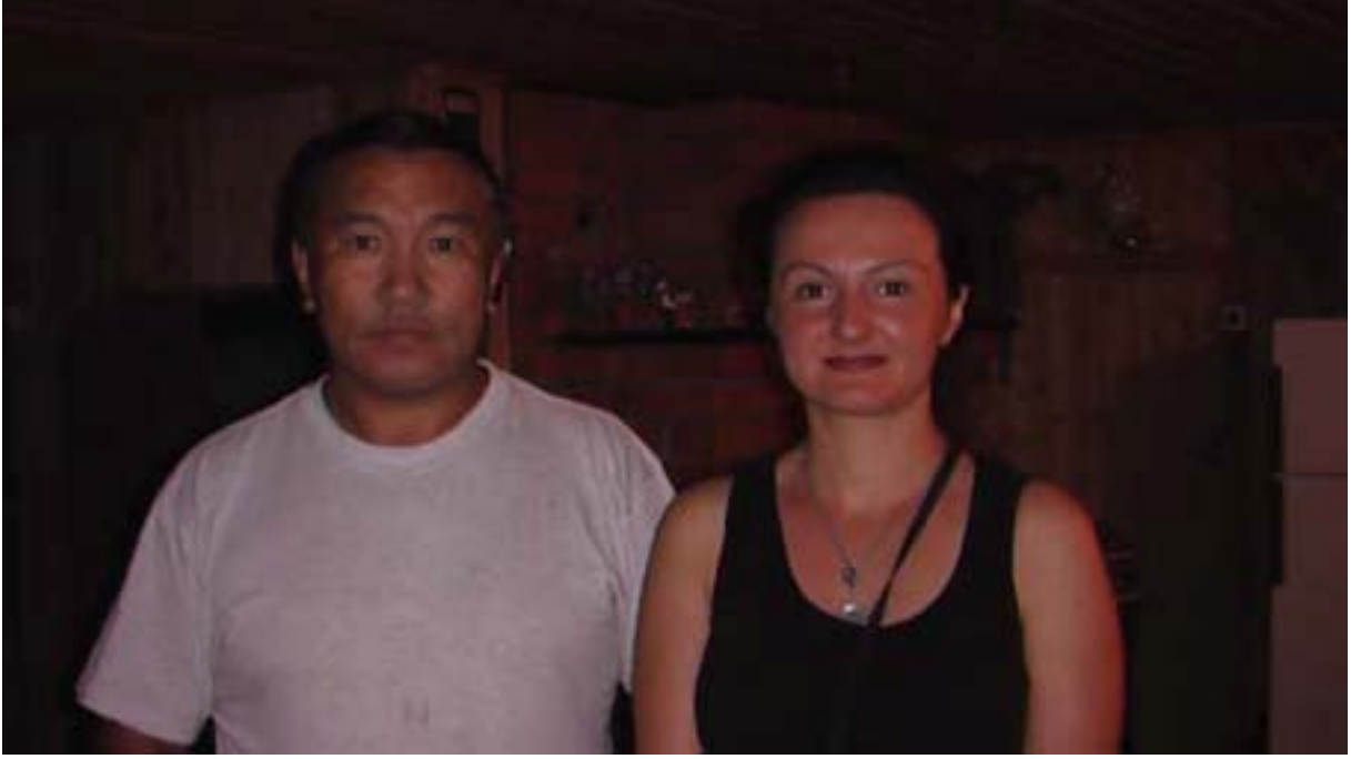
R.9 Bir Altay Kamı, Ağustos, 2006, Gorno Altay, G. Yücekal Ermetin