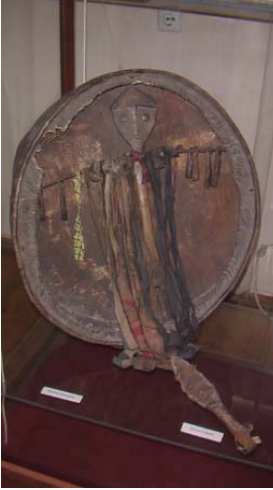
R.30 Altay Müzesinden Ön Cepheden Bir Kam Davulu, Ağustos, 2006, Altay, G. Yücekal Ermetin