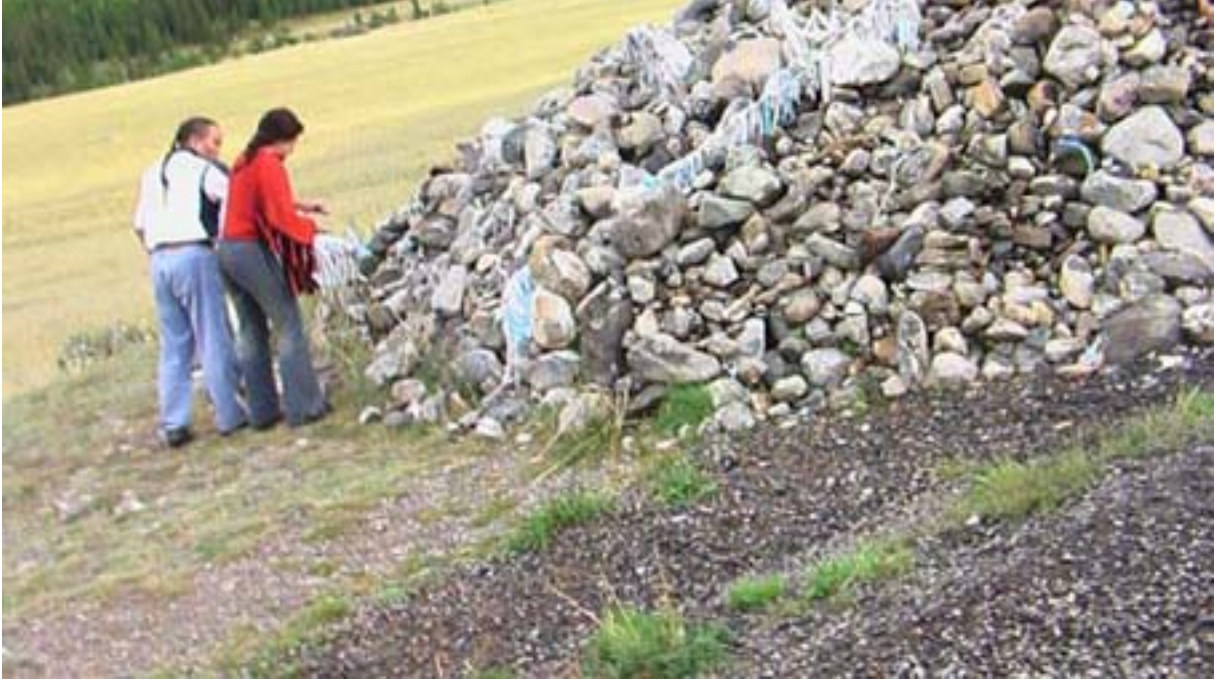
R.5 Bir Oba , Ağustos, 2006, Altay, G. Yücekal Ermetin