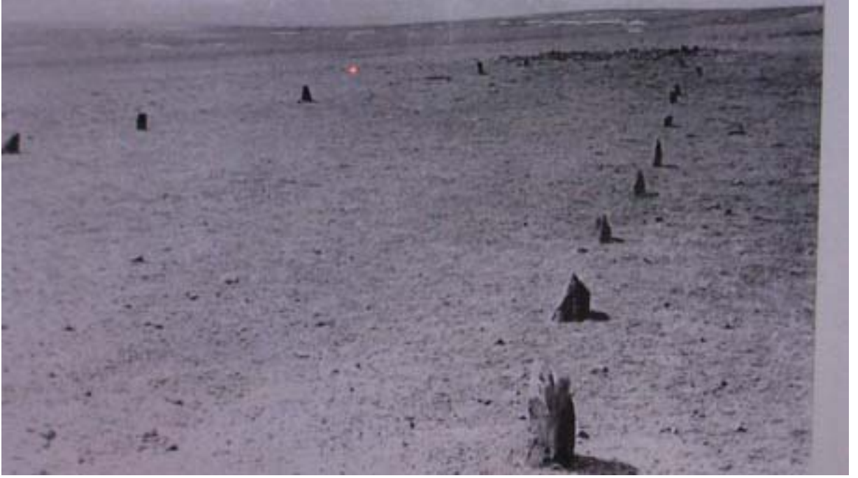
R.16 Altay Müzesinden Balballara Sahip Bir Kurgan, Ağustos, 2006, Altay, G. Yücekal Ermetin