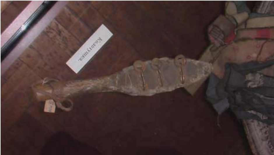
R.31 Altay Müzesinden Bir Kam Davul Tokmađı, Ağustos, 2006, Altay, G. Yücekal Ermetin