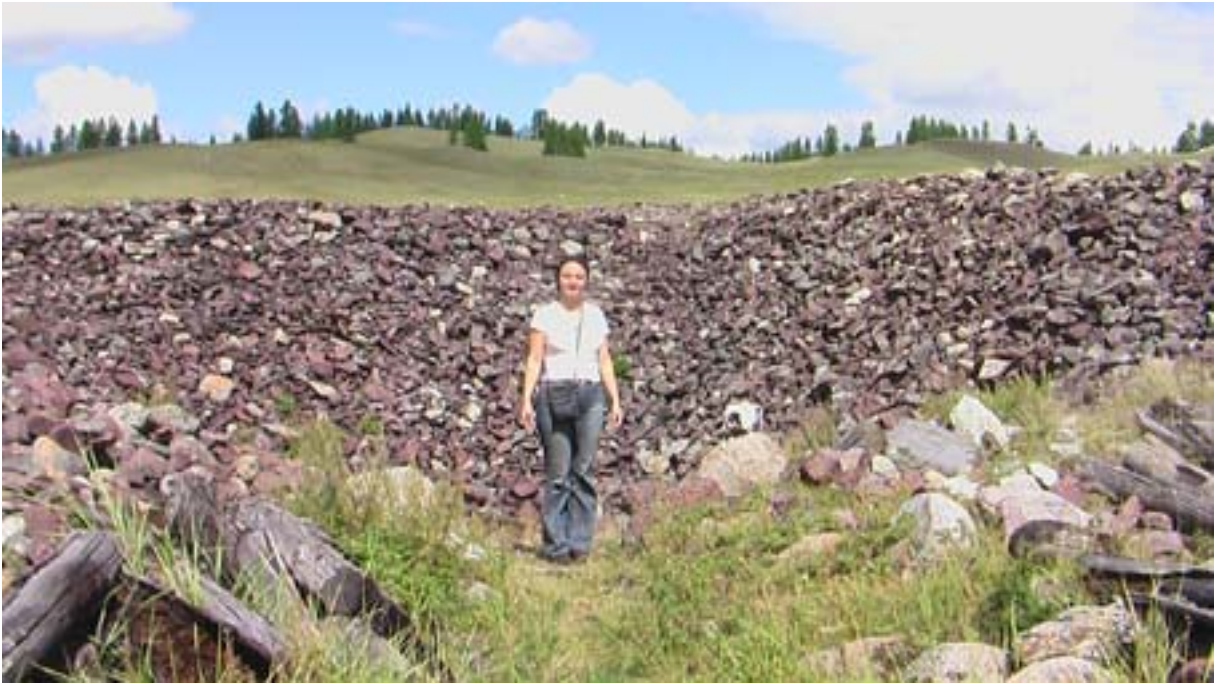
R.12 Pazırık Kurganları, Ağustos, 2006, Koşagaç, G. Yücekal Ermetin