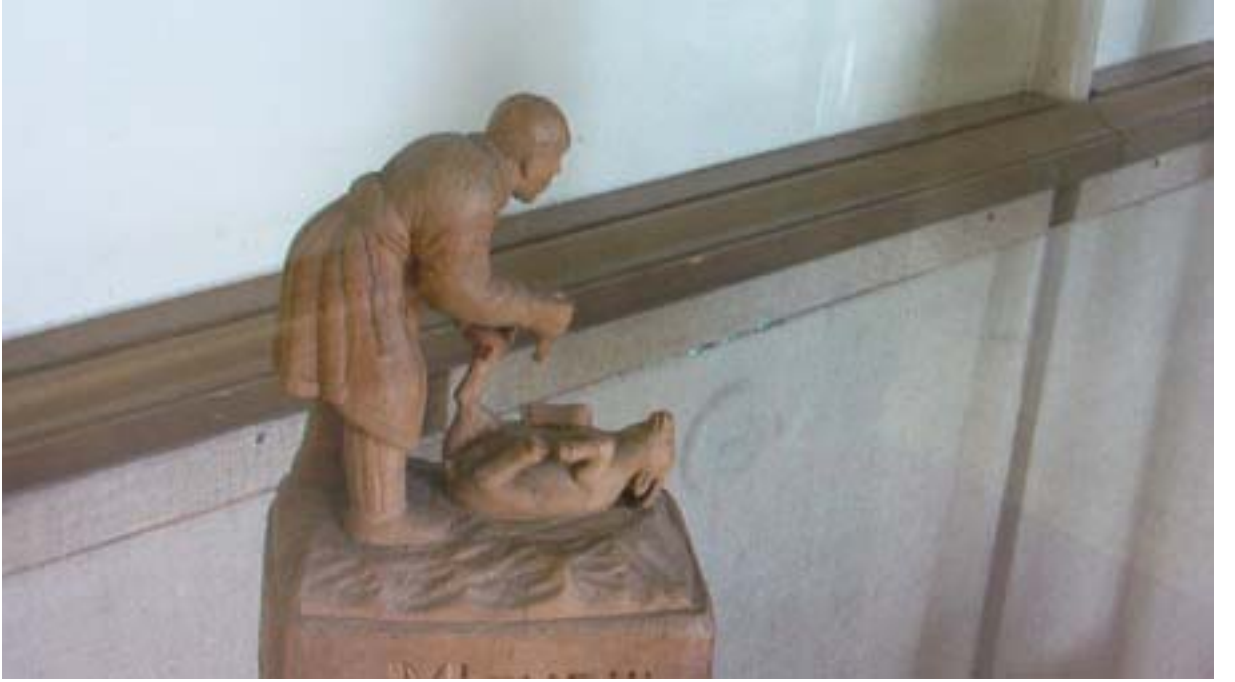
R.32 Altay Müzesinden Koç Kesim Şekli ile İlgili Bir Tasvir , Ağustos, 2006, Altay, G. Yücekal Ermetin