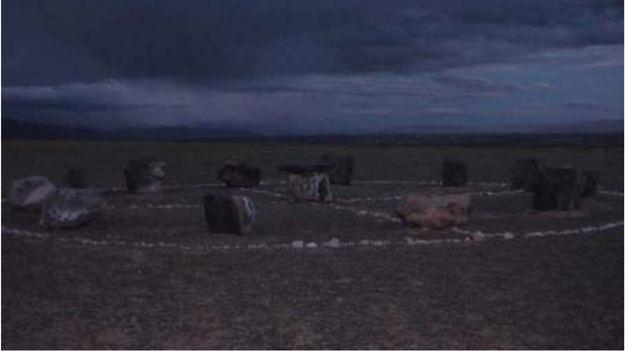
R.15 Sümer Dağlarının Eteklerinde Bir Mürgül, Ağustos, 2006, Altay, G. Yücekal Ermetin