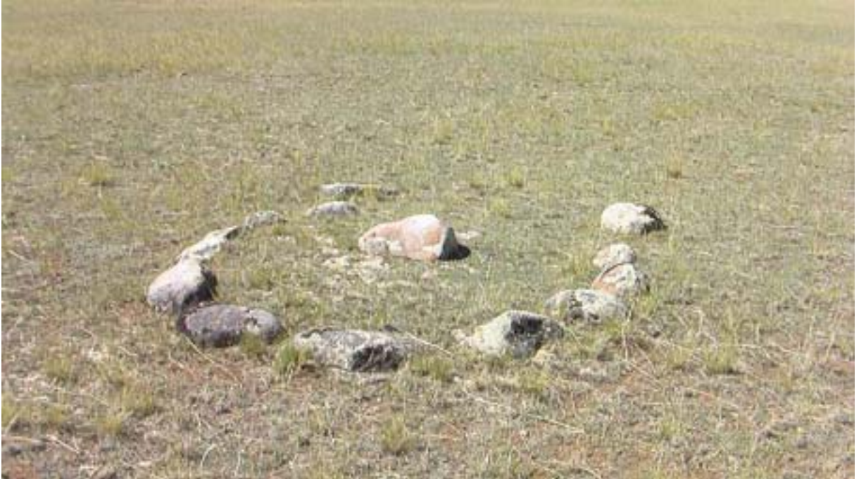
R.13 Koşagaçta Bir Kurgan, Ağustos, 2006, Koşagaç, G. Yücekal Ermetin