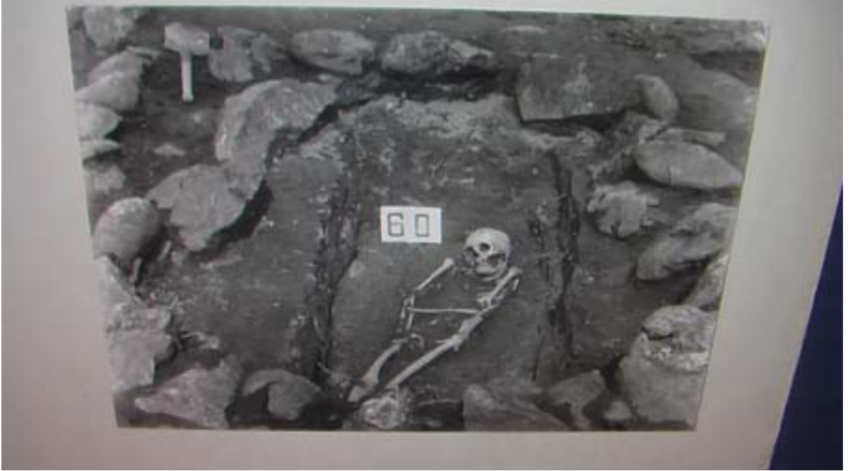
R.17 Altay Müzesinden Açılmış Bir Kurgan Resmi, Ağustos, 2006, Altay, G. Yücekal Ermetin