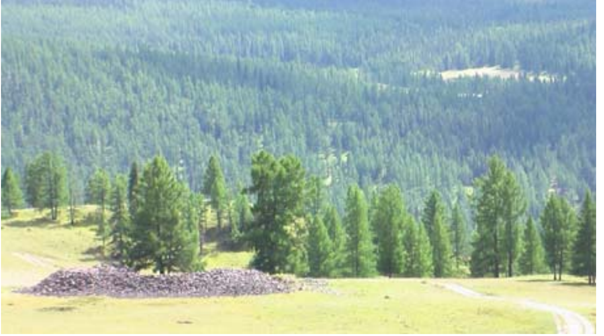
R.12 Koşagaçta Bir Kurgan, Ağustos, 2006, Koşagaç, G. Yücekal Ermetin