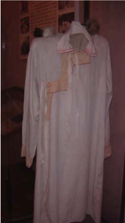
R.29 Altay Müzesinden Ön Cepheden Bir Kam Giyimi, Ağustos, 2006, Altay, G. Yücekal Ermetin