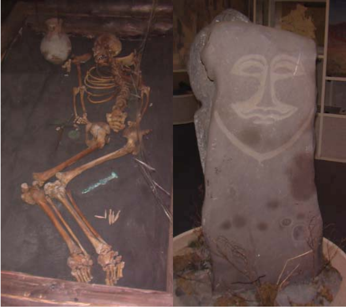
R.20 Altay Müzesinden Açılmış Bir Kurgan Resmi, Ağustos, 2006, Altay, G. Yücekal Ermetin