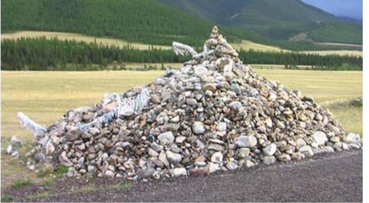
R.4 Yol Üzerinde Bir Oba, Ağustos, 2006, Altay, G. Yücekal Ermetin