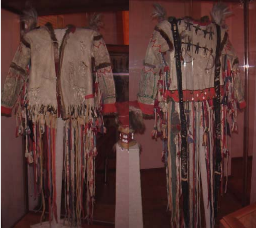
R.27 Altay Müzesinden Ön Cepheden Bir Kam Giyimi, Ağustos, 2006, Altay, G. Yücekal Ermetin