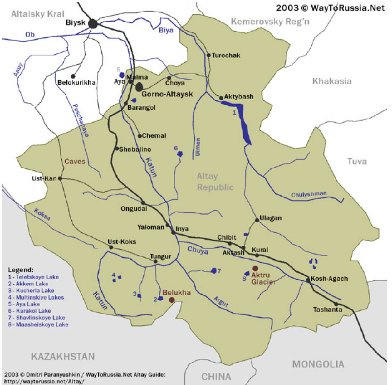
Harita 1 Altay Haritasi

http://www.waytorussia.net/Altay/MapAltay.html Eriřim Tarihi: 07.10.2006