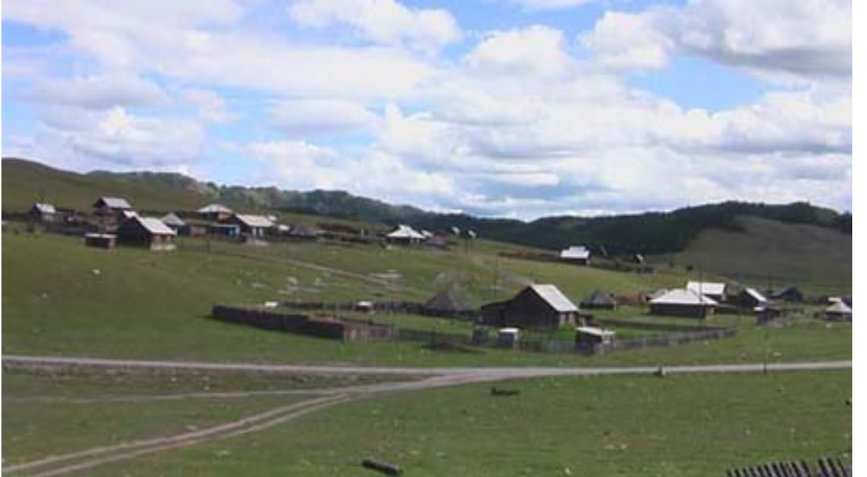
R.10 Koşagaç, Ağustos, 2006, Altay, G. Yücekal Ermetin