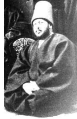
Mehmed Kemâleddin Efendi

Remzî Dede'nin belirttiği gibi Mesnevîhân, nüktedân, hâl ehli, ârif ve âlim biri olan Kemâl Efendi; aile arasında pehlivan yapılı, iri bir vücûda sahip, sağlıklı, canlı ve neşeli bir insan olarak anlatılmaktadır. Ayrıca Kemâl Efendi'nin vefatıyla ilgili, şöyle bir rivayet de dile getirilmektedir: Mevlevîhânenin vekilharçlığını, yani bir anlamda mâlî sorumluluğunu da yapan Kemâl Efendi, kışın yaklaştığı bir vakitte tekkenin damını aktarması için bir tamirci çağırır. Ancak gelen kişi yapacağı işin karşılığında biraz yüksek bir ücret isteyince Kemâl Efendi'nin canı sıkılır ve tamirciyi göndererek bu işi kendisi yapmaya karar verir. Gerçekten de dama çıkarak aktarma işini yapan Kemâl Efendi; bu sırada üşütür, hastalanır ve bir süre sonra vefat eder 4 .