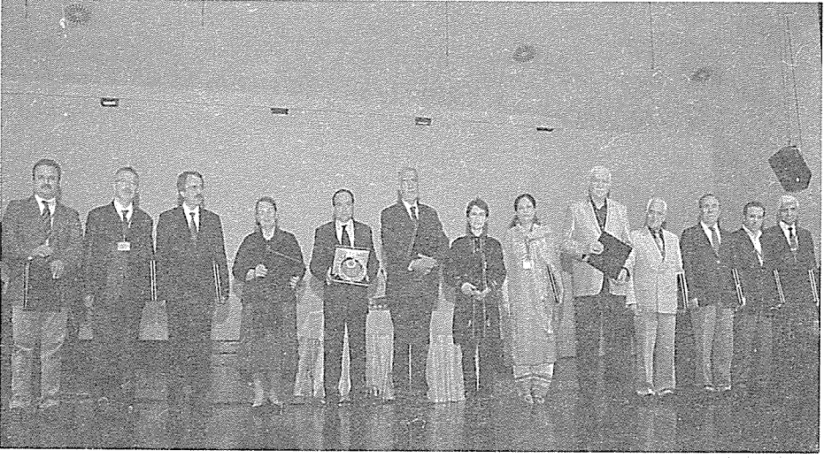
Sempozyuma Katkı Veren Katılımcılara Plaket Sunumu