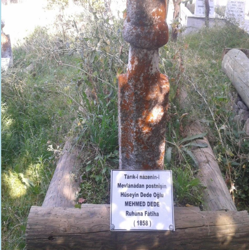
Burdur Yeşilova Niyazlar Köyü Niyaz Baba Türbesi haziresinde bulunan Tekke'nin Mevlevî Dedesinin mezarı ve taşı.

likle 1914 büyük depremde bir harabeye döndüğü "Dergah ve selamlık ve Haremin "tekrar inşası için yapılan girişimlerden anlıyoruz 18 .Cumhuriyetin ilk yıllarına intikal eden ve sonra tamamen yıkılan bölümün ise eski yapının küçük bir kısmının olduğunun kestirilmesi güç değil . Hatta 1857 'de dahi Burdur Mehmet Ahi Mevlevihane'sinin harap olduğu görülüyor 19 . Bu sırada yukarda adın andığımız Mevlevihane postnişini Şeyh Mehmet Efendi'nin gayretiyle Sultan Abdülmecit tarafından yeniden yaptırılmıştır. Şu hususu belirtmekte yerinde olacaktır :1826 da 2.Mahmut tarafından kapatılan Bektaşî tekkelerine diğer tarikat şeyhleri idaresine verilme bağlamında bazı Mevlevî dedeleri Burdur Erle(Yeşilova) kazası Niyaz Baba Tekkesinde görevlendirilmişlerdir. Örneğin 1858'de vefat eden Niyaz Baba Tekkesi şeyhi Postnişin Mehmet Dede idi.