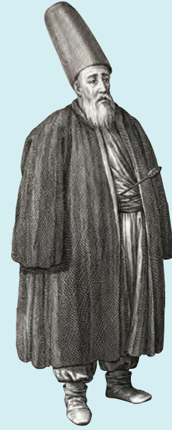
3- Mevlevi Şeyhi (solda) ve Mevlevi dervîşi (sağda) (d'Ohsson)

Tahirü'l-Mevlevî ve Mevlevîlik Hakkındaki Bazı Görüşleri", Din Bilimleri Akademik Araştırma Dergisi , 2009, yıl 9, sy. 3, s. 173-186 (www.dinbilimleri.com).