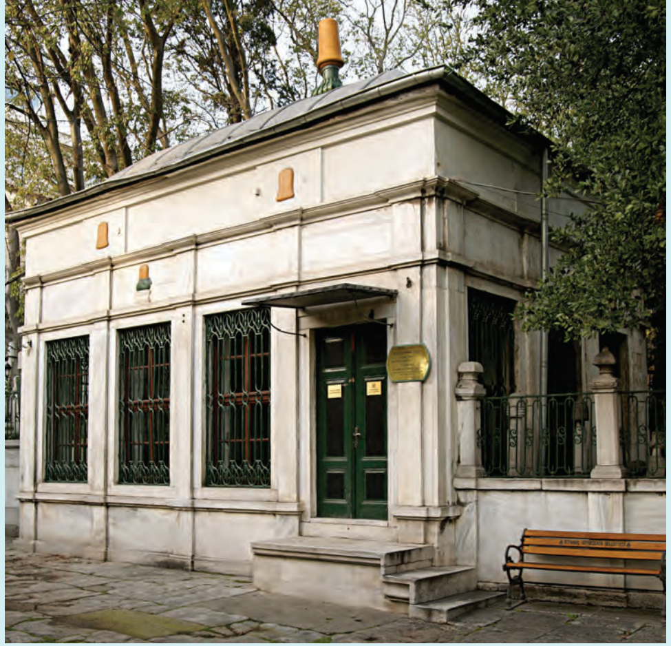
2- Galata Mevlihanesi bahçesinde yer alan Şeyh Galib'in türbesi