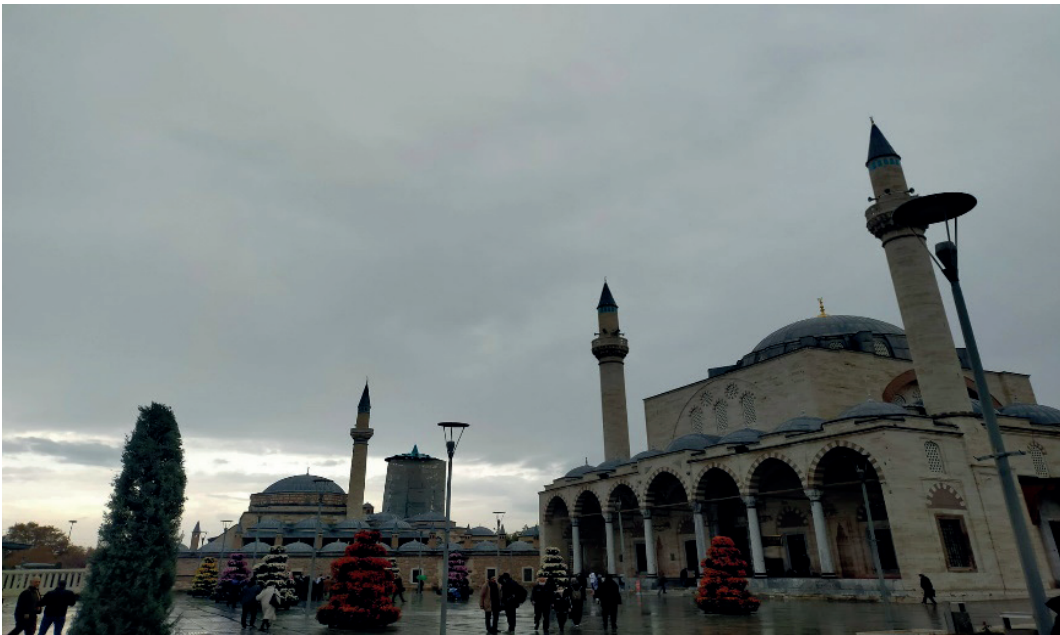
Fotoğraf 3: Mevlâna Türbesi'nin Selimiye Camii (Sultan Selim Camii)'nden görüntüsü.