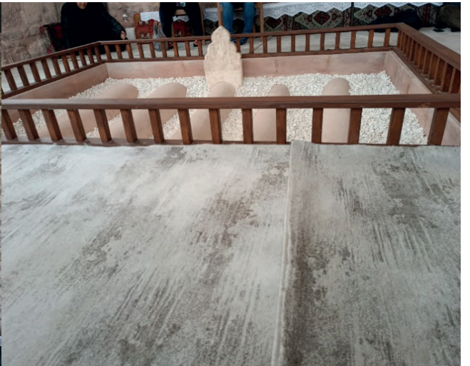
Fotoğraf 6-7: Eflaki Dede Türbesi'nde 2022 yılındaki Şeb-i Arûs Haftası'nda yapılan etkinlik.