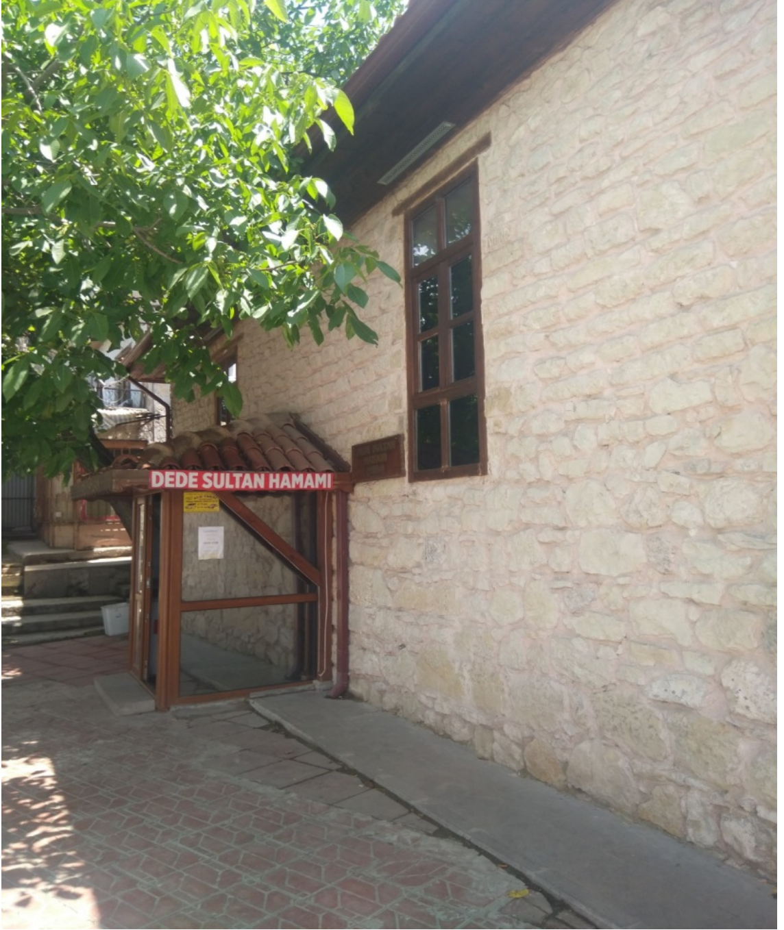
EK-9. Kastamonu Mevlevîhanesi'nden geriye kalan Dede Sultan Hamamı.