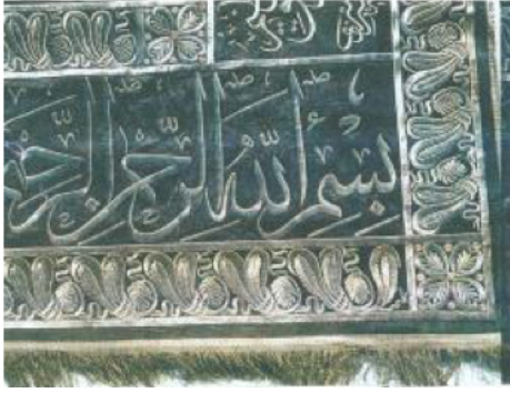
Şekil 3. 637 Envanter No'lu Puşide Levhasından Detay I.