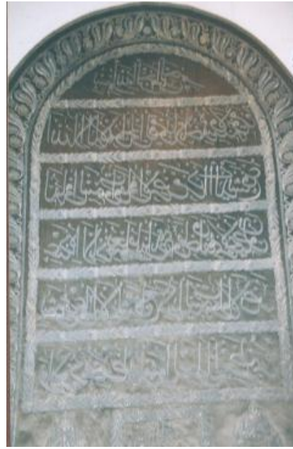
Şekil 6. 638 Envanter No'lu Puşide Levhasından Detay I.