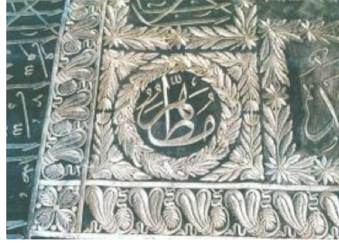
Şekil 4. 637 Envanter No'lu Puşide Levhasından Detay II.