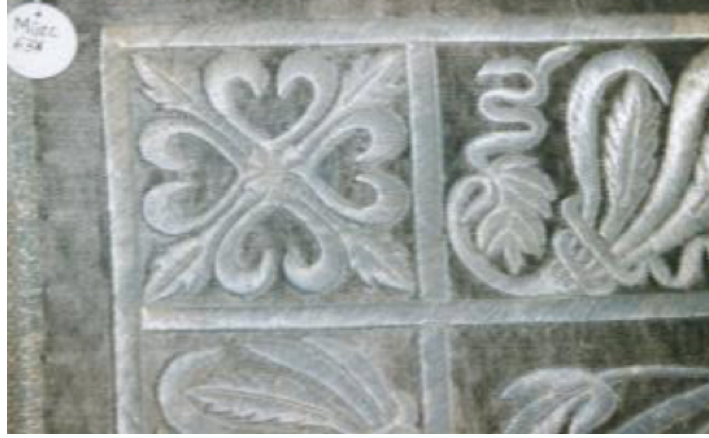
Şekil 8. 638 Envanter No'lu Puşide Levhasından Detay III.