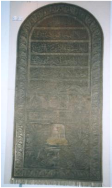
Şekil 5. 638 Envanter No'lu Puşide Levhası.