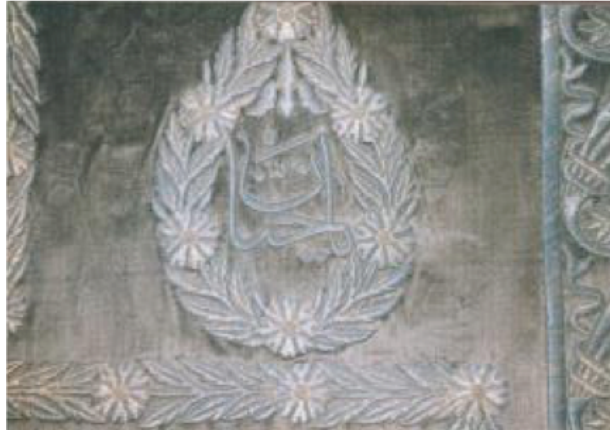
Şekil 7. 638 Envanter No'lu Puşide Levhasından Detay II.