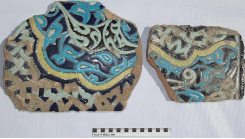
Fotođraf 4: Kubbe-i Hadrâ'nın Mevlâna Müzesi Tarikatçı Bahçesi'nde bulunmuş olan Karamanođlu Dönemi'nde yaptırılmış olan ilk çini örnekleri.