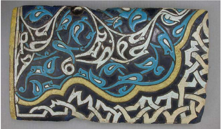
Fotoğraf 7: Kubbe-i Hadra'nın Metropolitan Müzesi'nde bulunan XIV. yy. Karamanoğlu Dönemi'nde yaptırılmış olan ilk çini örneği.