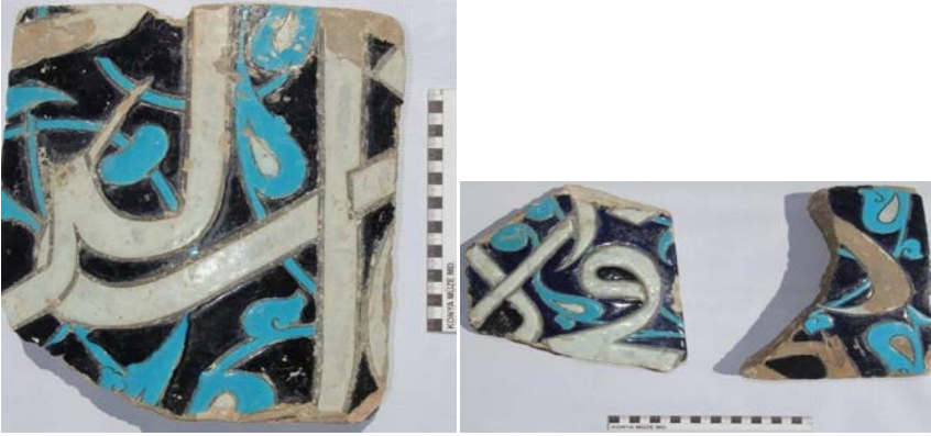
Fotođraf 10-11: Karatay Müzesi'nde bulunan Kubbe-i Hadra'nın İznik'te yapılmış olan türbe çinileri.