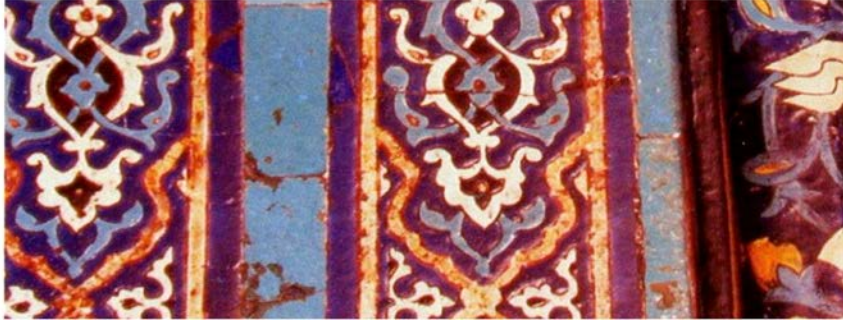
Fotođraf 9: Bursa Yeşil Cami, renkli sır teknikli çini örneđi (Mine Erdem'den)