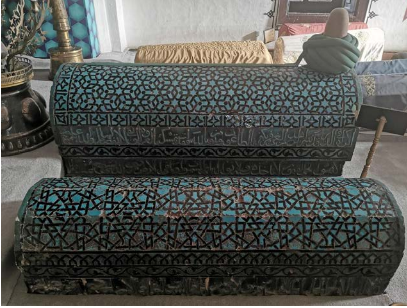
Fotoğraf 2: Mevlâna'nın mezarının batı yönünde yer alan Muzafferiddün Emir Alim Çelebi'nin 1277 tarihli çinili mezar sandukası ile 1283 tarihli Celale Hatun'un çiniden yapılmış mezar sandukası.