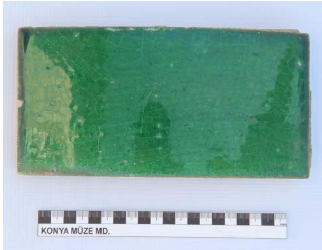
Fotoğraf 14: 1912 yılında Sultan Reşad tarafından Kütahya'da yaptırılan çini.