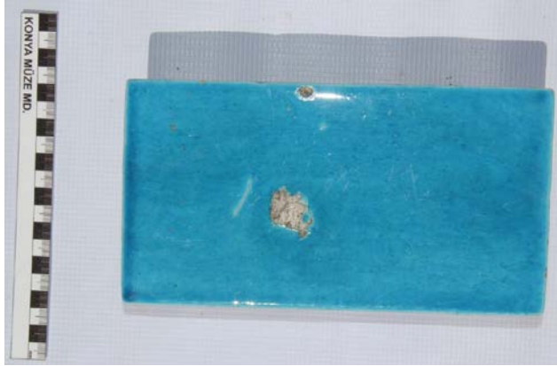
Fotoğraf 13: Tarikatçı Bahçesinde bulunmuş olan Kubbe-i Hadra'nın XIX. yy. da Kütahya'da yaptırılmış olan mavi renkli çini örneği.