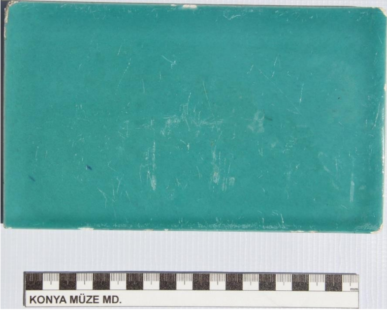
Fotođraf 15: Türbenin 1964 yılında Kütahya'da yaptırılmış çini örneđi.