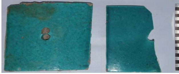
Fotoğraf 12: Tarikatçı Bahçesi'nde bulunmuş olan Kubbe-i Hadra'nın XIX. yy. da Kütahya'da yaptırılmış olan ortası çivi delikli çini örnekleri.