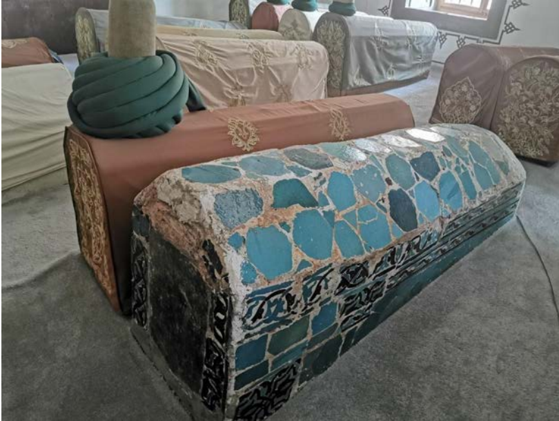
Fotoğraf 3: Mevlâna'nın mezarının doğu yönünde yer alan Sultan Veled'in oğlu Vacid Çelebi'nin 1342 tarihli mezar sandukası.