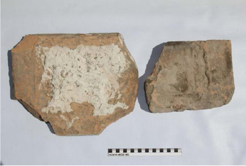
Fotođraf 5: Kubbe-i Hadrâ'nın Mevlâna Müzesi Tarikatçı Bahçesi'nde bulunmuş olan Karamanođlu Dönemi'nde yaptırılmış olan ilk çini örneklerinin sırt kısmından görünen hamuru ile harç kalıntılarından görünüm.