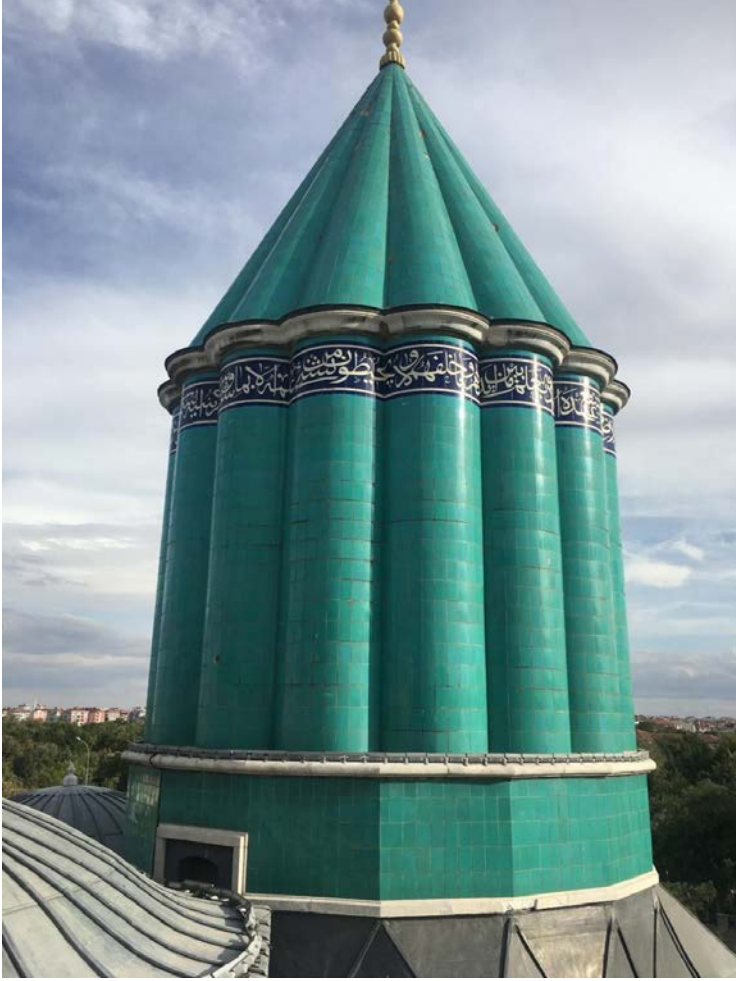
Fotoğraf 1: Mevlâna'nın Türbesi (Karamanođlu döneminde yaptırılmış olan dilimli gövde ve külahın 1964 yılında deđiştirilmiş olan günümüzdeki çinileri)