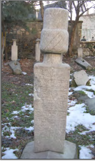
Resim 8- Şeyh Abdullah Efendi'nin Baş Taşı