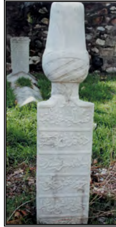
Resim 12a- Yahya Sâkıb Çelebi'nin Baş Taşı(N. Bakırcı'dan)

Mezarlığın kuzey batısında bulunan Yahya Sâkıb Çelebi'ye ait kabirden günümüze ancak ayak taşı ve pehle kısmı intikal etmiştir. 1994 yılında N. Bakırcı tarafından yapılan araştırmada ise baş taşının mevcut olduğu müşahede edilmektedir.(R.12). N. Bakırcı'nın çalışmasında yer alan baş taşına ait bilgileri buraya aktarıyoruz 18 :