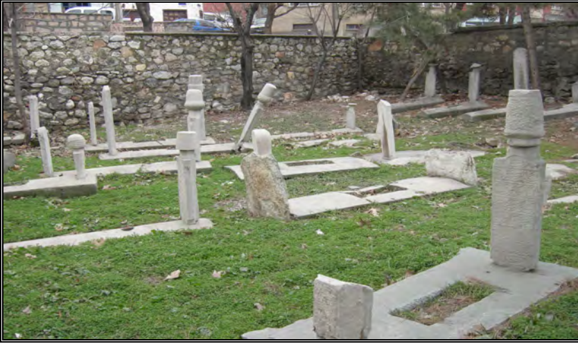
Resim 18-Hazirenin Kuzey Doğu Cepheden Görünümü