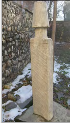
Resim 2- Hacı Molla zâde Salih Ziya Bey'e Ait Baş Taşı