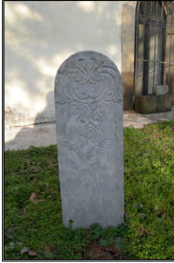
Resim 5a- Mehmet Faik Efendi'nin Ayak Taşı