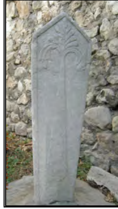
Resim 2a- Hacı Molla zâde Salih Ziya Bey'e Ait Ayak Taşı