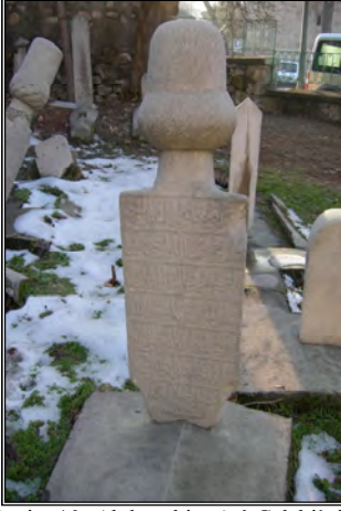
Resim 10- Abdurrahim Atâ Çelebi'nin Baş Taşı