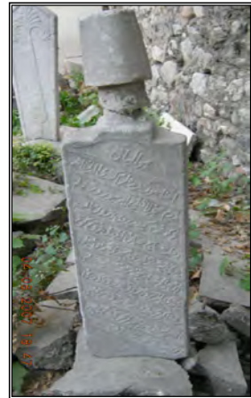
Resim 3- Hacı Molla zâde Abdurrahman Ferruh Çelebi'ye Ait Baş Taşı

Hazirenin güney duvarının ortalarındadır(R.3). Ayaktaşı günümüze kadar ulaşmamıştır. Mermer malzemeden oluşan taş 24x91x15 cm. ölçülerindedir. Celi ta'lik hat ile on satırlık kitabe yazı kompozisyonu oluşturulmuştur. Baş taşının tepelik kısmındaki Mevlevî sikkesi kırık durumdadır. Hacı Molla zade Abdurrahman Ferruh Çelebi'nin görevi hakkında detaylı bilgilerden mahrum durumdayız, ancak Molla zade ailesine mensup bir çelebi olduğu kitabeden anlaşılmaktadır.