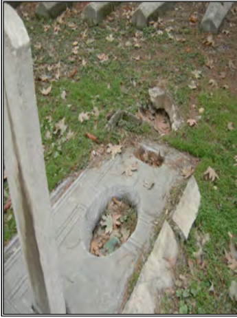
Resim 12- Yahya Sâkıb Çelebi'nin Mezarının Bugünkü Durumu