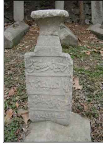
Resim 13- Nesibe Hanım'a Ait Baş Taşı

مرحومه ومغفور Merhume ve mağfur لها نسيبه lehâ Nesibe روحیچون فاتحه Ruhiçün fâtiha سنه ۱۲۱۶ Sene 1216