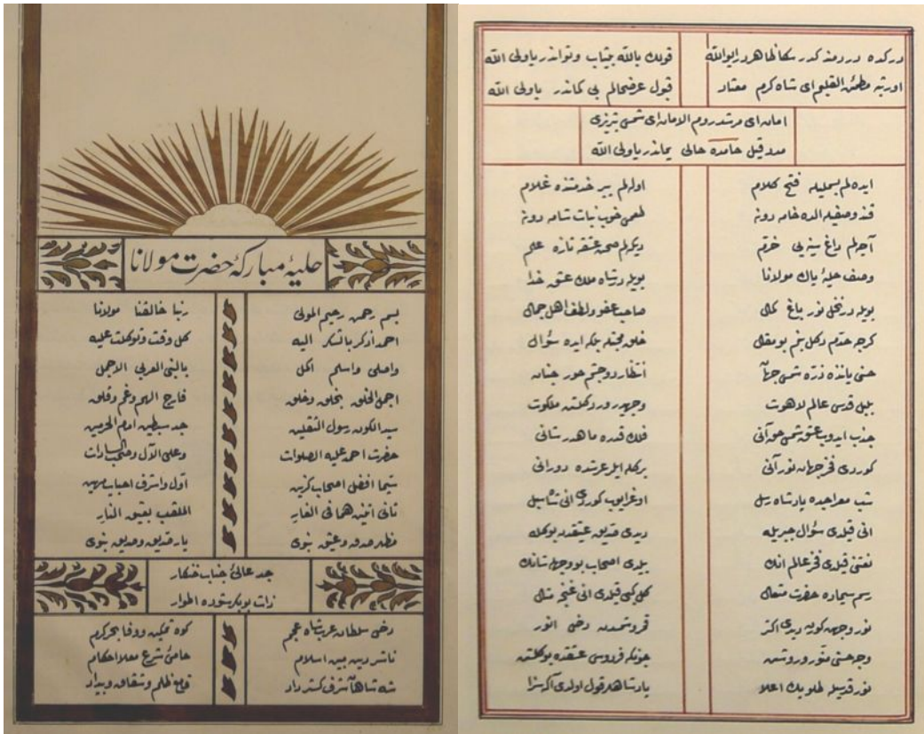
Rızâ'nın ve Tâhir'in hilyelerinden örnekler (sağdaki Rıza, soldaki Tâhir'in hilyesinden)