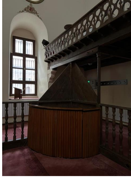
Resim 2: Afyon Mevlevihanesi'nde Mesnevihan maksûresi

Mevlevihanelerin mimarî özelliklerine de yansıyan Mesnevî okutma geleneği hemen hemen tüm mevlevihanelerde gerçekleşmiştir. Bu çalışmanın araştırma sahası olan şair mesnevihanların Mesnevî tkrir ettiği mevlevihaneler aşağıdaki tabloda gösterilmiştir.