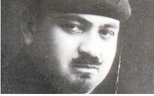
Muhammed Bakır Çelebi

Türkiye Cumhuriyeti sınırları içerisinde ise kapatılan Mevlevî tekkelerinin şeyhleri ve mensupları faaliyetleri yasaklandığı için bazıları değişik memuriyetlere devam etmiş, kimileri de maişetlerini kazanma gayretinde olmuşlardır. Böylece Mevlevîlik de diğer tarikatlar gibi faaliyetlerine son verildiği için tarikat faaliyetleri anlamında tarih olmuştur.