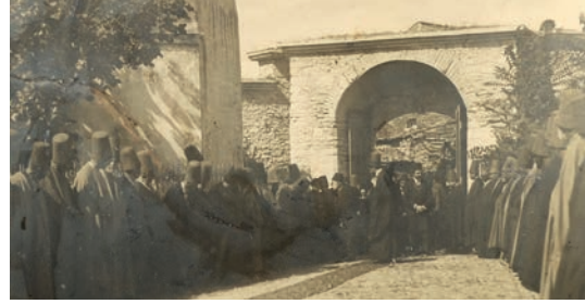
Sultan Reşad Yenikapı Mevlevihanesinde

binden kendini kurtaramamıştır. Bunda Abdülhamîd Han'ını memleketin içinde bulunduğu siyâsî çalkantılar sebebiyle memleketin her yerinde olup biten hadiselerle ilgili müteyakkız olması 1890 ve Celâleddin Dede'nin babası üzerindeki kuşkuların da etkisi olmuş, böylece dergâhla ilgili takibat devam etmiştir 1891 .