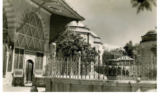
Mevlana Dergâhı

Zamanla Mevlevîlerle Osmanlı Devleti yöneticileri arasındaki irtibat güçlenmiş, Osmanlı padişahlarının eli Mevlevîliğin üzerinden hiç eksik olmamıştır. I. Murad zamanında 789/1387 yılında Vezir-i âzam Çandarlı Halil Hayreddin Paşa'nın oğlu Ali Paşa Serez'de bir mevlvihâne inşa ettirmiş 1805 , daha sonraki yıllarda II. Murad (1421-1451) Edirne'de büyük bir Mevlevî dergâhının açılmasını sağlamıştır. Fatih Sultan Mehmet 872/1467'de Konya Kalesi'nin tamiri ile birlikte türbe ve mevcut diğer yapıları da elden geçirtmiş ve türbeye bazı vakıflar bağışlamıştır. Konya Mevlevîhanesi semahanesi Sadrazam Gedik Ahmed Paşa (ö. 887/1482) tarafından yeniden inşa ettirilmiş 1806 , II. Bâyezit döneminde de türbenin iç süslemeleri yapılmış, 918/1512 yılında da Yavuz Sultan Selim dergâha bir şadırvan inşa ettirmiştir 1807 . Bu günkü matbah ise derviş hücrelerinin bir kısmı ile birlikte III. Murad'ın hayratıdır 1808 . Kanunî de Mev-