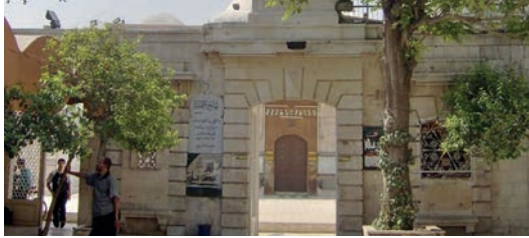
Halep Mevlevîhânesi Giriş ve Minaresi