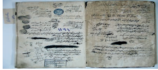
Defter-i Dervîşân

Mehmed Çelebi tepki göstermiştir 1877 . Mehmet Çelebinin tepkisi yine de Mevlevîlerle Osmanlı padişahlarının arasına bozmamış, III. Selim ve II. Mahmud dönemleri başta olmak üzere, XIX. asır içindeki bütün padişahlar Mevlevîliğe yakın ilgi göstermişler ve padişahların bu yakın ilgi ve alakaları devletin tüm kademesindeki memurları tarafından da desteklenmiştir. Bu destek sayesinde Osmanlı toprakları içinde bulunan bütün mevlvîhâneler, başta tamir ve iâşe olmak üzere birçok ihtiyaçlarını karşılamakta pek zorlanmamışlardır 1878 .