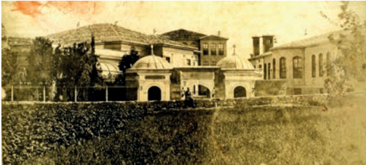
Yenikapı Mevlevîhanesi

Mevlevî tarîkatı çevrelerince II. Mahmud gibi Mevlevî kabul edilen Sultan Abdülmecîd, Mevlevî tekkelerindeki Mesnevî öğretim sistemini yayma düşüncesiyle Dârü'l-Mesnevî ler açtırmış 1881 , Sultan Abdülazîz döneminde de "Meclis-i Meşâyih"ın kurulmuş, 1283/1866'da faaliyete geçen bu meclisin ilk reisliğini de Yenikapı Mevlevîhanesi şeyhi Osman Salahaddin Dede üslenmiştir. Osman Salahaddin Dede'nin bu makama layık görülmesinde salahiyetiyle birlikte, devrin padişahı Abdülazîz'in Mevlevî muhibbi ve aynı zamanda neyzen olmasının da tesiri olmuştur 1882 .