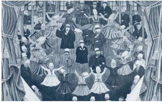
Vesim Paşa'nın çizdiği 1890'da Mevlevî Şeyhlerinin Beraber Sema'sı

bestelenen âyinler; İtrî'ye kadar, İtrî'den İsmâil Dede'ye kadar ve İsmâil Dede sonrası olmak üzere tarihî seyirler izlemiştir 1863 . Mevlevî mûsikîsinin intişar ettiği yerler Mevlevî tekkeleri olmuş, başta İstanbul olmak üzere bütün Mevlevî dergâhları bir konservatuar görevi yapmış ve bu merkezlerden, bestekârlar, küdümzenler ve neyzenlerle birlikte diğer mûsikîşinaslar yetişmiş, Mevlevî olmayan mûsikî mensupları da buralardan faydalanmıştır 1864 .