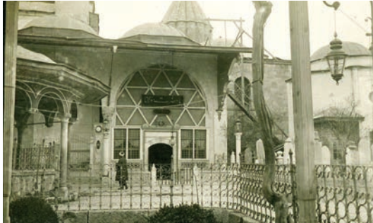
Konya Mevlana Dergâhı

evlilikten doğan Musa, İsa çelebiler ve Çelebi Mehmet Mevlânâ torunudur, Çelebi unvanını almaları da bu sebeptendir 1803 ve çelebiler Osmanlı padişahlarını kendilerine akraba saymışlardır. Bu akrabalık tarihte Osmanlı padişahları tarafından Mevlevî tarikatinin korunup gözetilmesi, bazı padişahların -III. Selim ve Sultan Reşad gibi- Mevlevî olmaları ve tahta geçen Osmanlı padişahına Çelebi Efendinin kılıç kuşatması şeklinde tezahür etmiştir. Osmanlı padişahlarının da Mevlânâ Dergâhı başta olmak üzere Mevlevîliğe ve Mevlevîhanelere daima yardımları devam etmiştir 1804 .