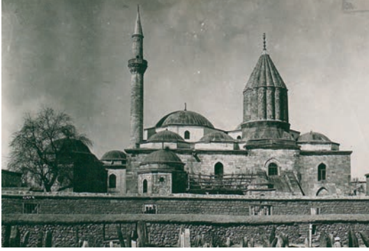
Konya Mevlana Dergahı ve Türbe

rek merâsim ve kurallardan uzak bir tasavvufî anlayış ortaya koymuştur 1765 .