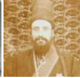
Veled Çelebi

Sultan Veled döneminde tarîkat idarî olarak da teşkilatlanmış ve tarikatta Çelebilik makamı ihdas edilmiştir. Mevlevîlik Sultan Veled'den sonra kendi soyundan gelen ve kendilerine "Çelebi" veya "Çelebi Efendi" 1785 denilen şeyhler tarafından idâre edilmiştir. Bu makama da "Çelebilik Makamı" denilmiştir 1786 Söz konusu bu süreç içerisinde; Sultan Veled ailesine mensup (Zukûr Çelebi) erkek üyelerden en yaşlısı, "Çelebi Efendi" unvanıyla Konya Mevlânâ Dergâhı postuna geçmesiyle tarîkat merkeziyetçi bir anlayış çizgisinde yönetilmiştir 1787 . Bu makamda bulunan Çelebi Efendi, Mevlânâ'nın