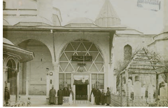
Mevlana Dergâhu Huzur-ı Pir

ve zâviyeler diye iki gruba ayrılmıştır 1816 . Mevlevîliğin ilk dönemlerinden itibaren içerisinde çile çıkartılan büyük Mevlevî yapılarına âsîtâne denildiği gibi küçük Mevlevî tekkelerine zâviye tâbir olunmuştur 1817 .