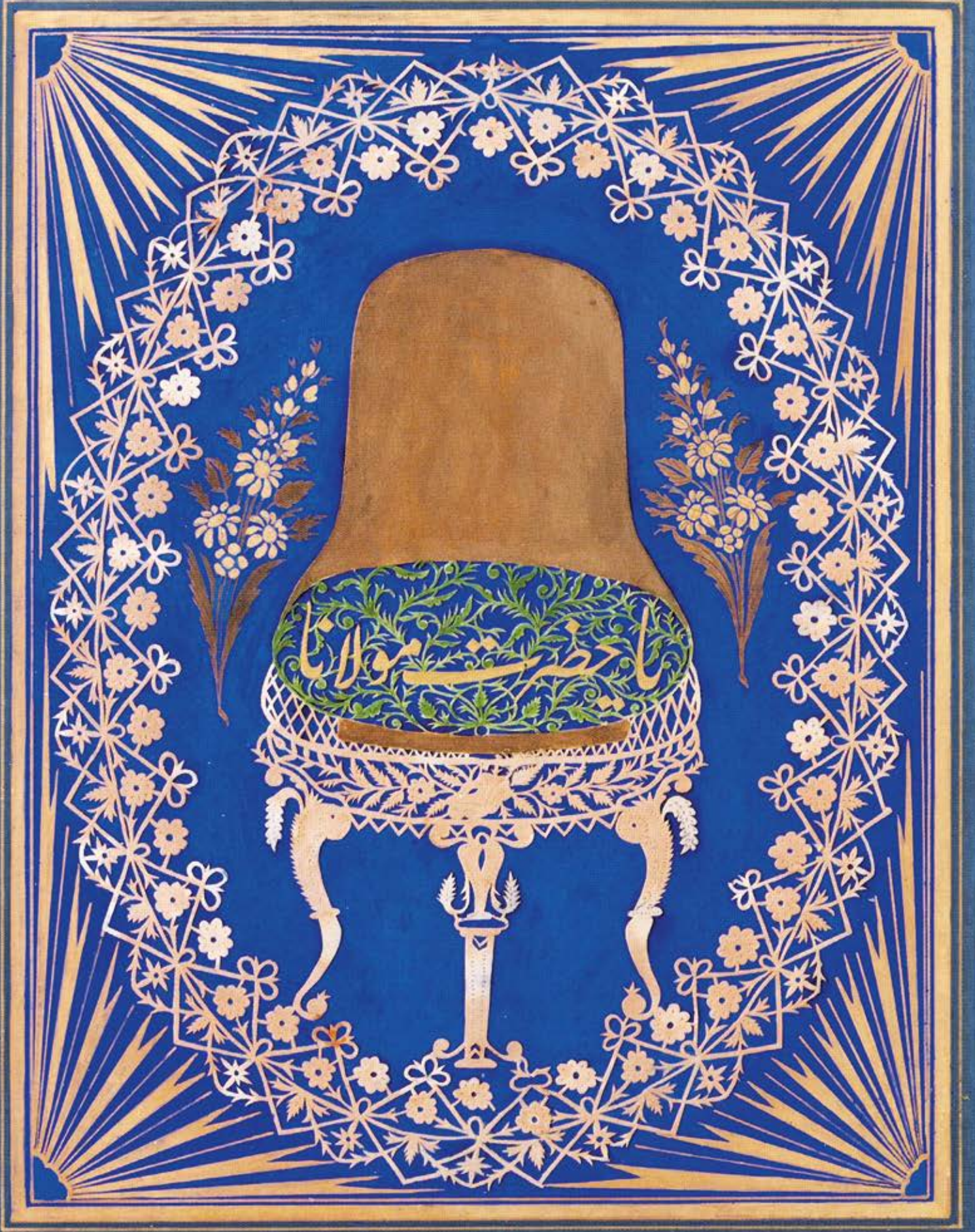
Kat'ı sanatıyla imal edilmiş sikke formunda bir tekke levhası A tekke script levha in sikke form produced with the art of Kaat'ı (paper filigree)