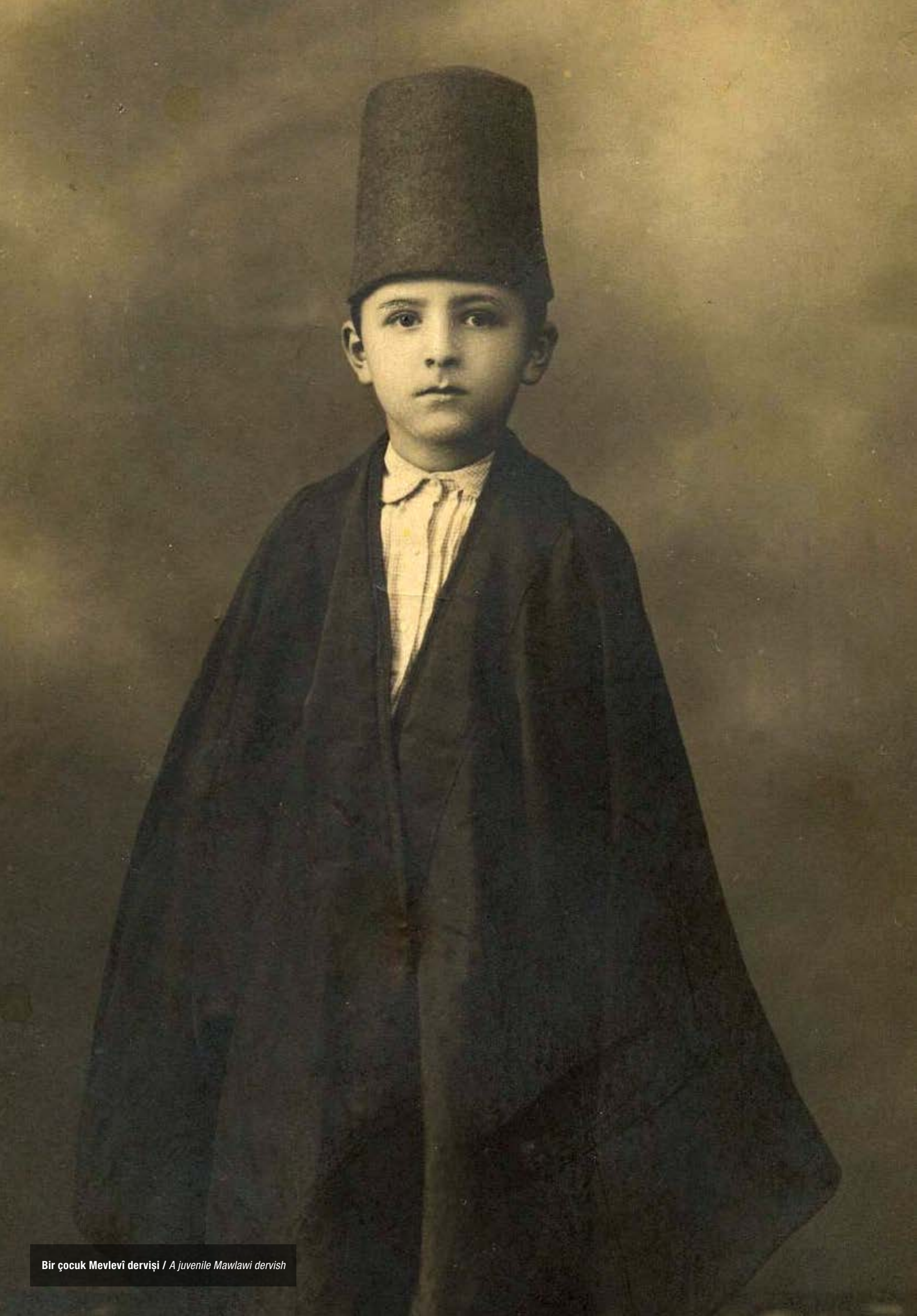
Bir çocuk Mevlevî dervişı / A juvenile Mawlawi dervish