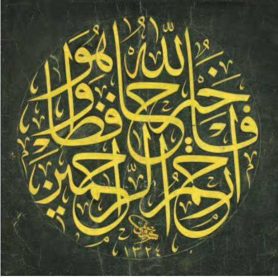
Resim 7: Ömer Vasfi Efendi'nin celi sülüs bir istif kalıbı

Burada rik'a ve Kâmil Akdik'den (1861-1941) dîvânî , Sâmî Efendi'den (1838-1912) celî dîvânî yazılarını ve İsmail Hakkı Altunbezer'den (1873-1946) tuğra çekmesini öğrendi.