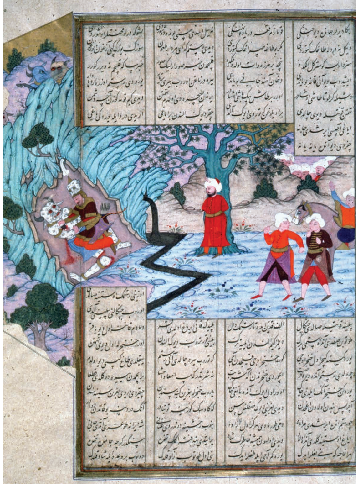
Resim 3: Derviş Abdî'nin burde ta'lik hattıyla yazdığı Şehnâme'den bir sahife