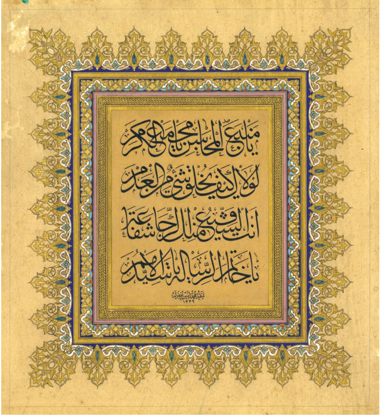
Resim 9: Neyzen Emin Yazıcı'nın sülüs hatıyla yazdığı enfes bir levhası