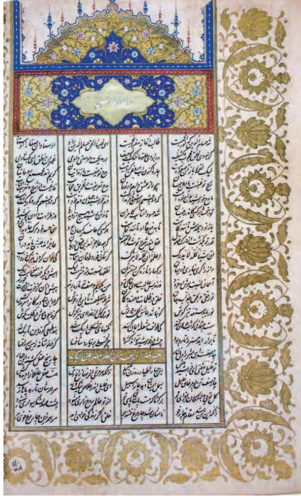
Resim 4: İbrahim Cevri'nin hurde ta'lik yazdığı Mesnevi nüshasının 5. cildindeki unvan sahifesi

Burasının sonraki hattatı Karînâbâdi Hasan Hüsni Efendi (ö.1914) onun talebesidir. 1874'de Üsküdar Mevlevîhânesi'ne şeyh olarak tâyin edilen Mehmed Zeki Dede burada ve Ramazan aylarında bazı camilerde Mesnevî derslerini sürdürdü. 31 Aralık 1881'de vefat ederek Mevlevîhâne'nin hazîresine defnolundu.