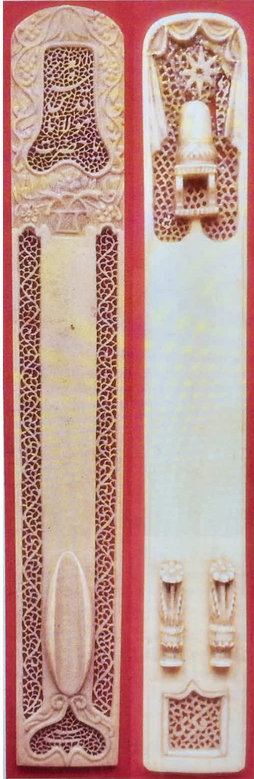
Resim 2: Mevlevî dervişlerinin eseri olan iki makta : (solda) Resmî, (sağda) Fikrî (Topkapı Sarayı Müzesi'nden)

ilgili bir rumuz yahut ismin daima yer aldığı ve bu tarikatın inceliğini gösteren maktalar , kamış kalemin üstüne konulduktan sonra ucunun kattedildiği (düzeltilerek kesildiği) bir âlet olarak hattatların daima yanlarında bulundurdukları levâzımdandı.