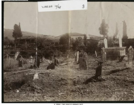
Resim: XIX. Yüzyılda Selanik Mevlevîhânesi'nin Cepheden Görünüşü ve Mezarlığı 50

Evliya Çelebi'nin kısımları hakkında bilgiler verdiği mevlevîhânenin haremî kale gibi demir kapılı olup, geniş meydanının ortasındaki semâhânesinin dört yanı parmaklıklarla çevrilmiştir. Ayrıca semâhânenin kubbesi ve etrafındaki güzel sütunlar oldukça sanatla süslenmiş ahşap yapılarıdır. Mevlevîhânenin aydınlatmasının ise kıymetli avizelerle yapıldığını anlatan Evliya, yüz civarında dedesi bulunduğundan da söz eder 49 .