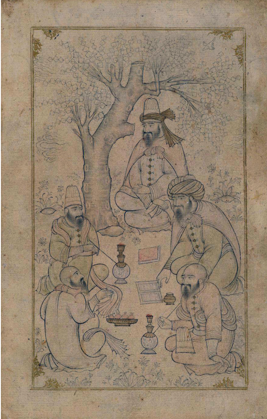
Dervişlerin bir meclisi.

müridlerinden de beklemiştir. İbn Bezzâz'ın naklettiği bir olayda, müezzinin sesindeki tatlılığın gittiğini fark eden İbrahim Zâhid Geylânî, müezzine bunun nedenini sormuş ve birinden ekmek istediğini söylemesi üzerine de şeyh, onun artık sohbetlerine layık olmadığını söylemiş ve müezzin bir daha onun meclisinde ezan okumamıştır. İbrahim Zâhid Geylânî'ye olağanüstü hâllerini övünerek anlatanlara karşı sükûnetle yaklaşmış ve gerçek kerâmetin tevazu ve güzel ahlâk olduğunu vurgulamıştır.