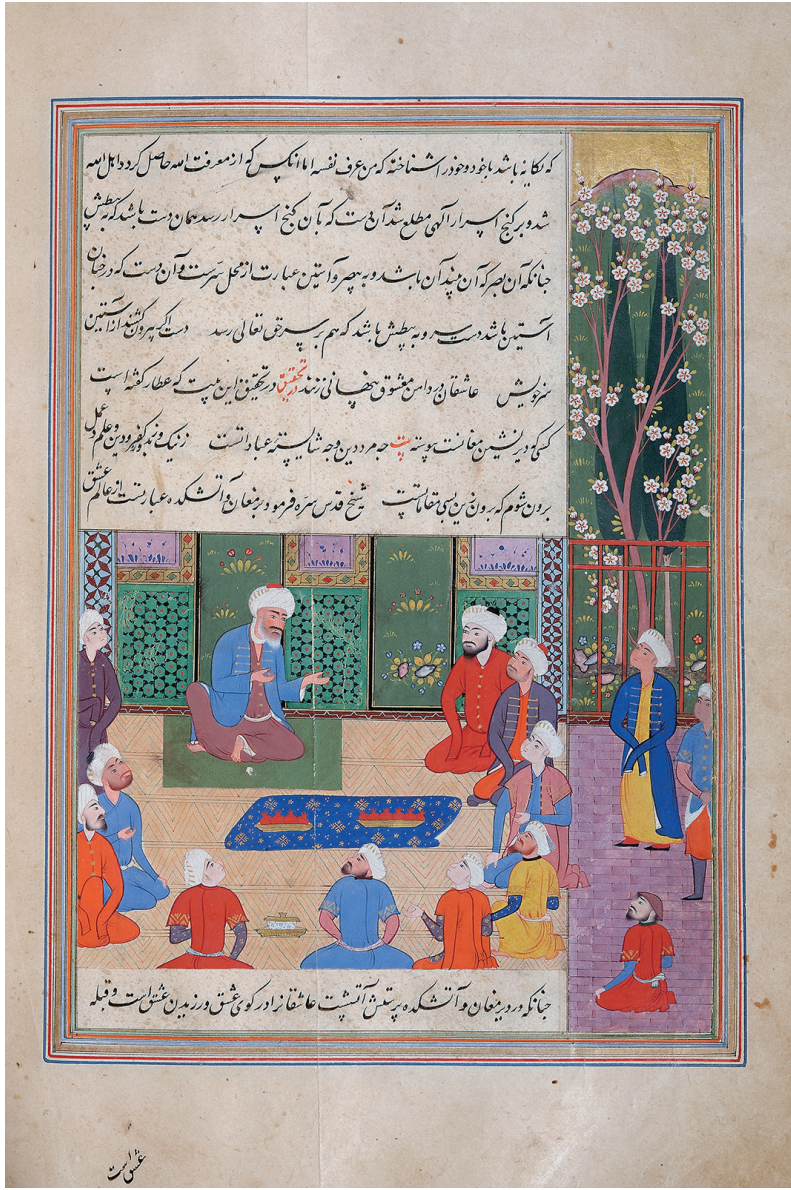
Safiyüddin Erdebili'nin dervişleriyle bir meclisi. İbnü'l-Bezzâz, Safvetü's-Safâ, Aga Han Museum

Horasan'dan gelerek Azerbaycan'a yerleştiği düşünülmektedir. İbrâhim Zâhid Geylânî, 615/1218 yılı civarında, Hazar Denizi kıyısında yer alan ve sıcak, nemli iklimi sayesinde Moğol istilasında dahi bağımsız kalabilmiş Gilân eyaletinin Siyâvrûd nahiyesinde doğmuştur.