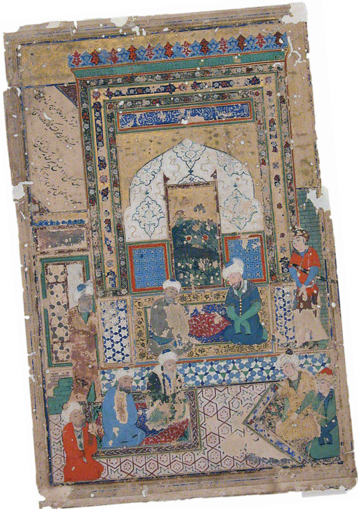
Süfîlerin toplantısı. Metropolitan Müzesi, New York