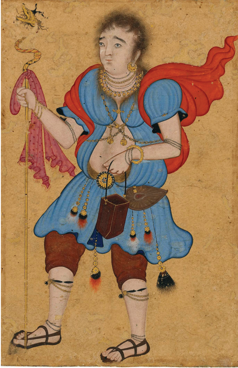
Kalenderî derviş. British Müzesi

ve farklılaşma arayışıyla öne çıkmıştır. Bu bakımdan Kalenderîlik, tasavvuf tarihinde Melâmetîliğin daha uç ve heterodoks nitelikler taşıyan bir yorumu olarak değerlendirilmektedir.