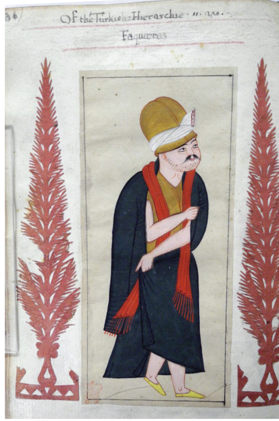
Mevlevî. Albüm, British Müzesi

olan dervişler için “Şems meşrebinde” ifadesi kullanılmaya devam etmiştir. Şems’in, “Ben mürid kabul etmem, fakat şeyhleri irşad ederim; her şeyhi değil, kâmil olanı” ( Maḳâlât , s. 227) sözü, onun kendisini klasik tarikat silsilelerinden bağımsız bir irşad vazifesi içinde gördüğünü ortaya koyar.