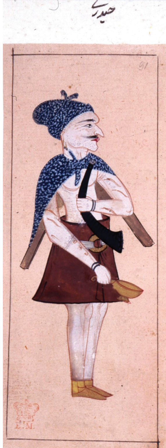
Haydarî dervîşi. Albüm, British Müzesi

_____, Konuşmalar: Makalât (trc. M. Nuri Gencosman), İstanbul 2006.