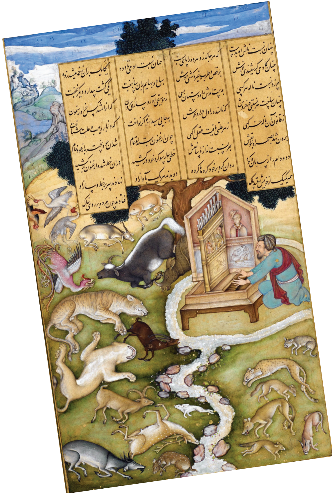
Platon müzik icra ederek hayvanları büyülüyor. Hamse, Nizâmî, British Kütüphanesi