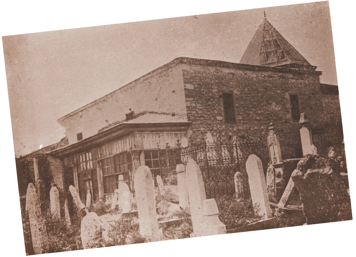
Şems-i Tebrizi Camii ve Kabristanı