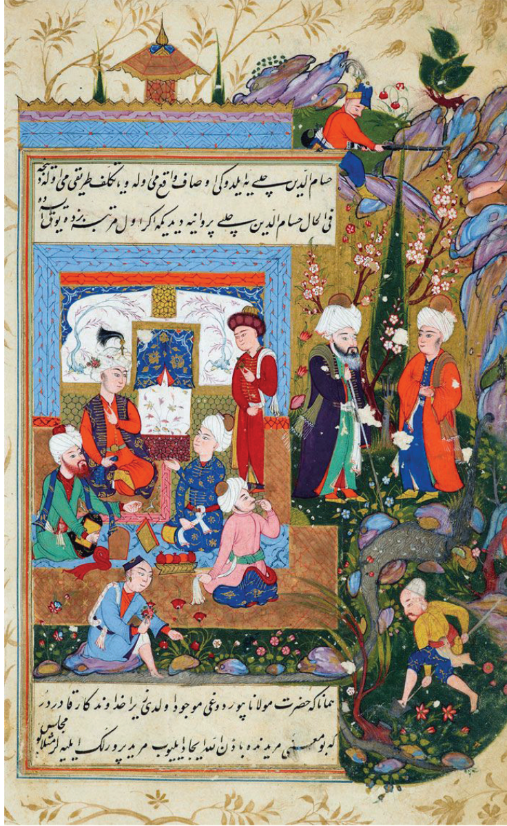
Hz. Mevlânâ ve Hüsameddin Çelebi bir meclise iştirak ediyorlar. Sevâkıb-ı Menâkıb Tercümesi, Morgan Kütüphanesi

pek hoş karşılamaz. Sözlerindeki tekrardan dolayı kendisini bilgisizlikle suçlayan birisine: “Bu sözleri diğer kulakla dinle, meşâyihiñ sözlerini işitmiş olan kulakla dinleme! Bu sözün konuşulduğu yerde Beyâzid Bistâmî’nin ve onun ‘kendimi takdîs ederim şânım ne yücedir’ gibi sözlerinin ne yeri vardır” derken ona karşı tavrını ortaya koymuştur.