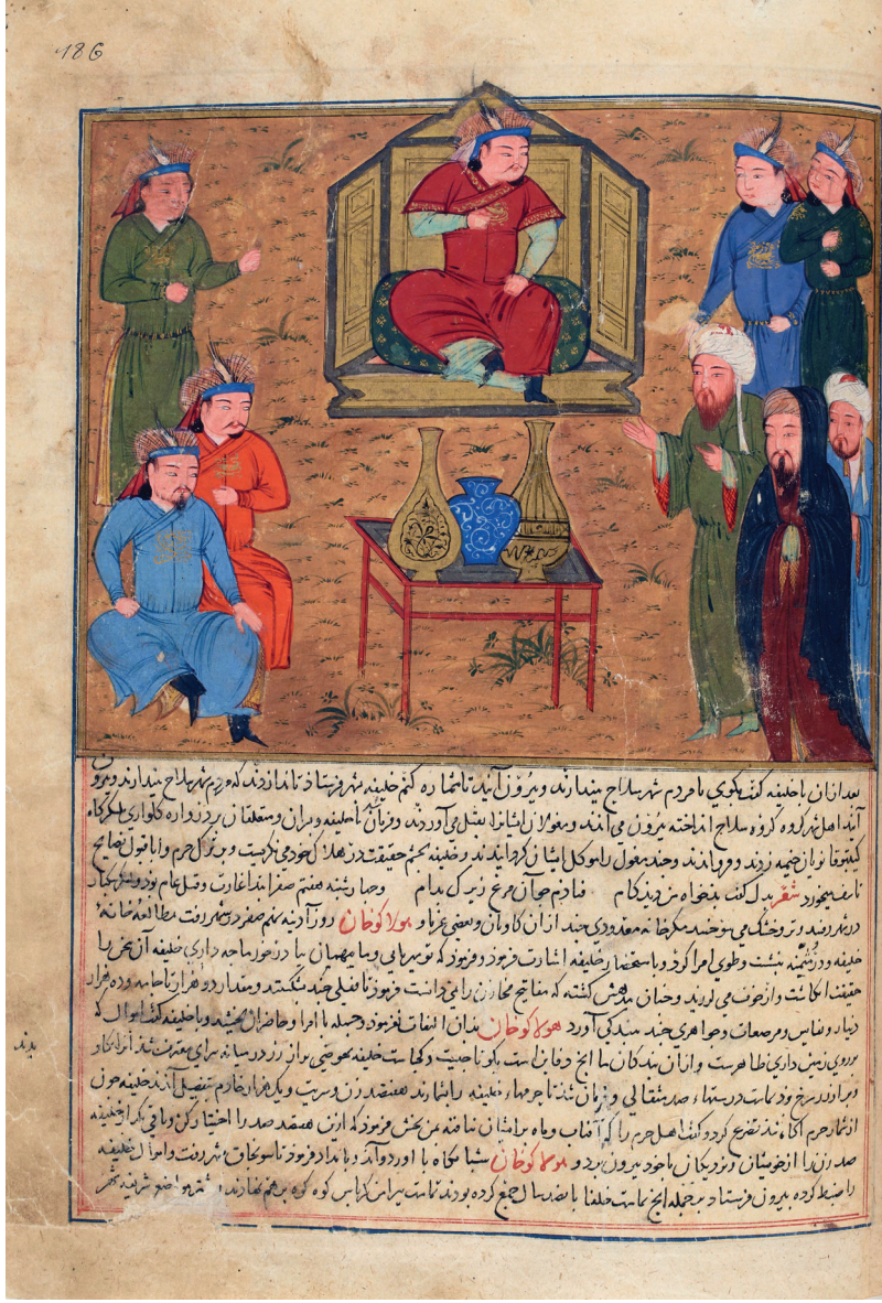
Hülagu Han ve Abbâsi Halifesi Mu'tasım billah. Reşidüddin Fazlullah, Camiu't-Tevârih, Bibliothèque Nationale de France

sokmaz. Bunun yanı sıra Şems'in Moğollar hakkında söyledikleri de onun bu işgale nasıl baktığını açıkça ortaya koymaktadır. Şems'in Kayseri'den itibaren Moğol işbirlikçisi olduğu ithamı da zaten tarihlerin uymaması sebebiyle hiçbir gerçekliği olmayan bir