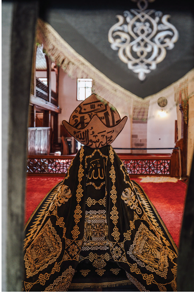
Şems-i Tebrizi sandukası

kırsalar, eyvab niçin bu kafesi parçalasınlar ki (diyorsun); bu kuş kendini kurtarsın, içindeki cerahatler, pislikler dışarı çıksın diye. Sen hemen feryadı bastırıyorsun: O çıbanı niçin deşsinler? İçinde birikmiş olan cerahat niçin dışarı aksın?"