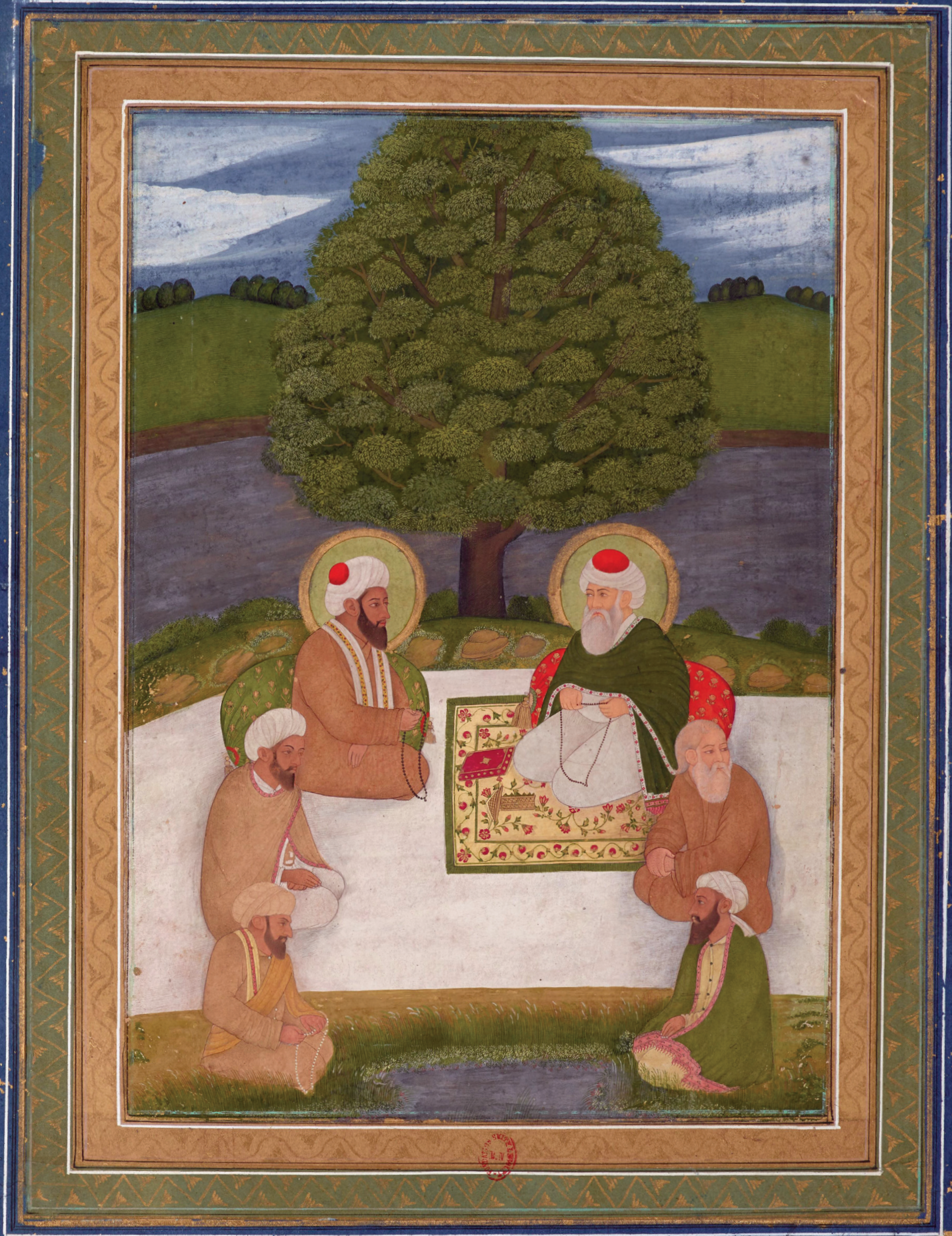
Portraits de Six Religions Monothéistes.