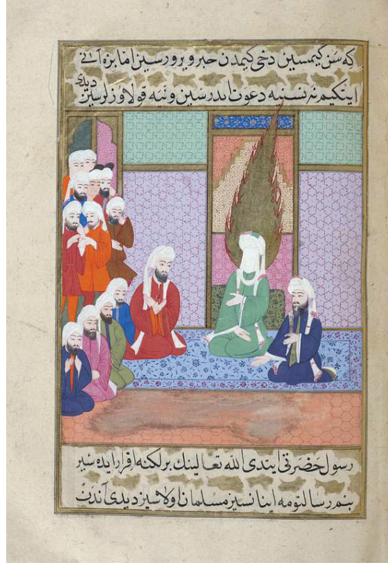
Hz. Peygamber'in önünde İslâm'ı kabul eden bir grup. Siyer-i Nebî, Darîr

tasavvufî düşüncesinin temelini oluşturur. Örneğin, “Şeytan, kanın damarlarda hareket etmesi gibi, insanoglunun damarlarında hareket eder” 4 hadisini zahiri anlamıyla reddederek, başka bir manada anlamak gerektiğini ifade etmesi, 5 onun hadislere olan derinlemesine ve sezgisel yaklaşımını gösterir. Şems için önemli olan, hadisin lafzına takılıp kalmak değil, onun ruhuna nüfuz etmek ve taşıdığı hikmeti kavramaktır.