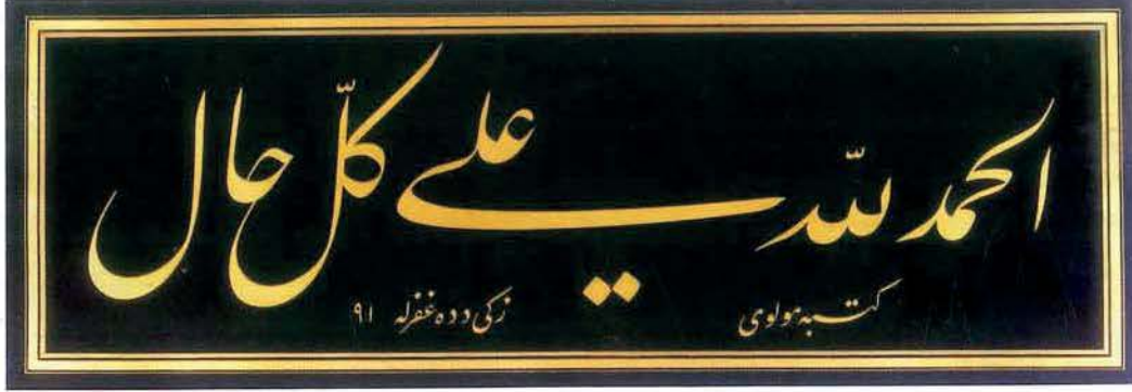
Zeki Dede'nin hattı

tında bulunan 13 adet çeşitli türden yerli ve yabancı saat ile 1 adet takımlarıyla beraber saatçi tezgâhı Zeki Dede'nin saat imalatçısı olduğunu ortaya koymaktadır. Zeki Dede'nin çeşitli türden epeyce tesbih ve tesbih ham maddesi ile ecza takımı vs de muhallefatında yer almıştır.