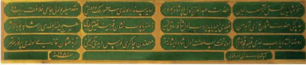
Zeki Dede'nin hattı

Dergâh şeyhlerine verilegelen aylık 82 kuruş maaş ise Zeki Dede'nin bu makama gelmesiyle ona tahsis olunmuştur.