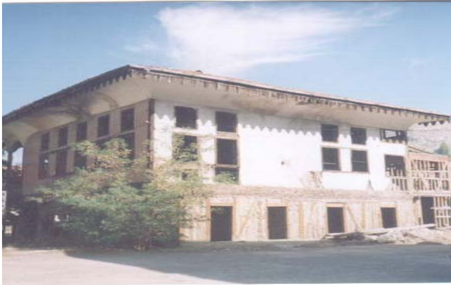
Tokat Mevlevîhânesi'nin Doğu Kısmı