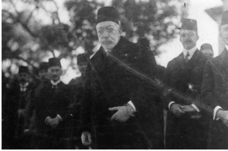
Sultan Reşad açılış töreninde