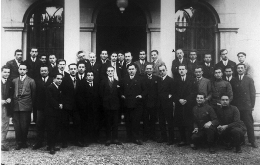
Abdülbaki Baykara Edebiyat Fakültesi'nde