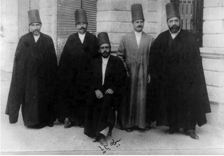
Şeyh Abdülbâkî dervişlerle

Abdülbâkî Efendi'nin şeyhliği devrinde, daha önceden Sultan Abdülhamid tarafından çok ciddî bir gözetim altında tutulan Yeni-kapı Mevlevîhânesi, Sultan Reşad'ın padişah olmasıyla bir hayli rahatlamıştır.