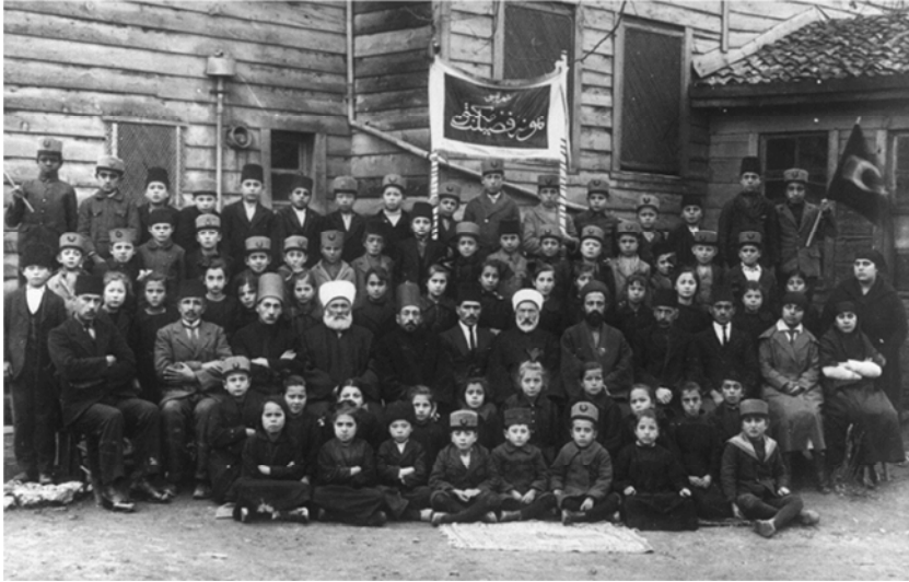
Osmanlı devrinde bir mektep