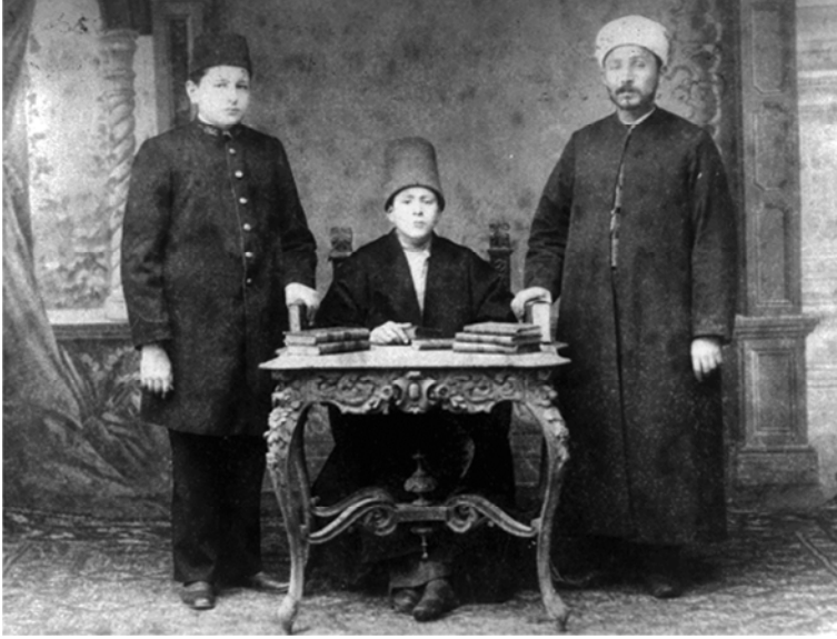
Abdülbaki Efendi (ortada) Hocası ile

ça, Sütlüce Sa'dî Dergâhı şeyhi ve Meclis-i Meşâyih Reisi Elif Efendi'den tasavvuf ve Mesnevi dersleri alarak sonunda Mesnevi (1906) ve ilmiyye (1908) icâzetnâmeleri almıştır.