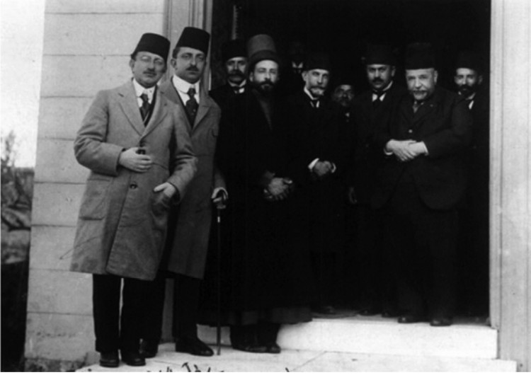
Şehzadelerin ve devlet adamlarının tekkeyi ziyareti