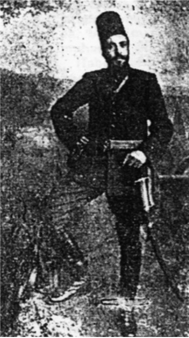
Abdülbâkî Dede asker kıyafetiyle

Abdülbâkî Dede, Osmanlı Devleti'nin birçok savaş ve âfetlerle uğraştığı çok sıkıntılı bir dönemde şeyhlik yapmıştır. Balkan ve Trablusgarp Savaşları, I. Dünya Savaşı ve en son da Kurtuluş Savaşı. Tabii ki bütün millet gibi Yenikapı Mevlevîhânesi ve mensupları da bu dönemlerdeki toplumsal sıkıntılardan etkilenmiştir.